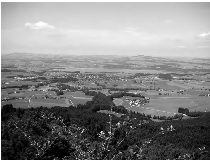
Abb. 2: Panoramablick vom Steinwandl gegen W auf Henndorf und den Wallersee

Kurz vor Erreichen des Steinwandls bietet sich ein faszinierender Blick in das Gletscher-verschmelzungsgebiet Thalgau/Enzersberg. Hier standen sich im Würm-Hochglazial die Eisfronten des Unzinger-Zweiggletschers (Salzachgletscher) und die des Thalgauer-Zweiggletschers (Traungletscher) gegenüber. Mit beginnendem Eiszerfall entstand hier ein See, der in Form einer Deltaschüttung verfüllt wurde. Die gut gewaschenen und sortierten Schotter und Sande wurden bereits zum Bau der Reichsautobahn abgebaut und zu weiteren baulichen Zwecken genutzt.