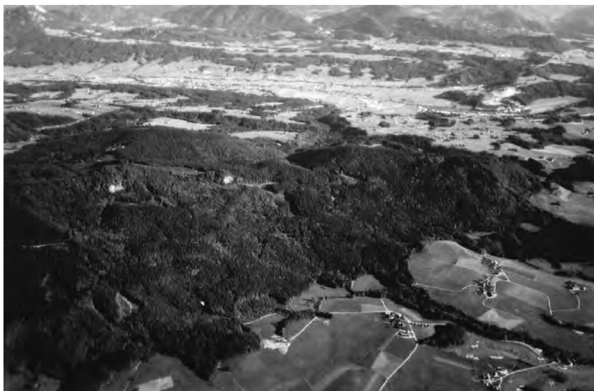
Abb. 1: Die Eiszeitlandschaft Henndorf mit den Hausbergen Steinwandl und Große Plaike (Flugaufnahme gegen SE)