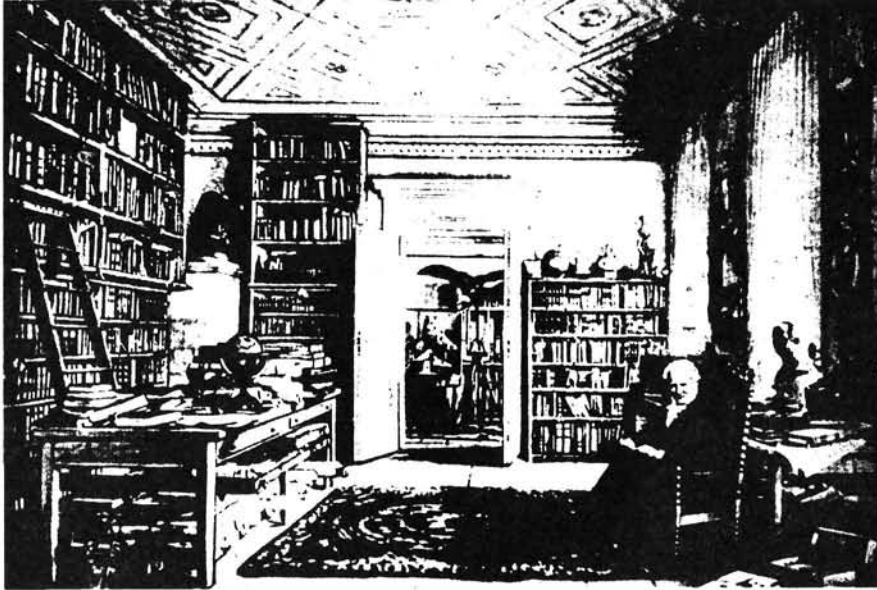
Abb. 1 HUMBOLDT in letzten Lebensjahren in seiner Berliner Wohnung in der Oranienburger Straße Nr.67 in seiner reichhaltigen Bibliothek