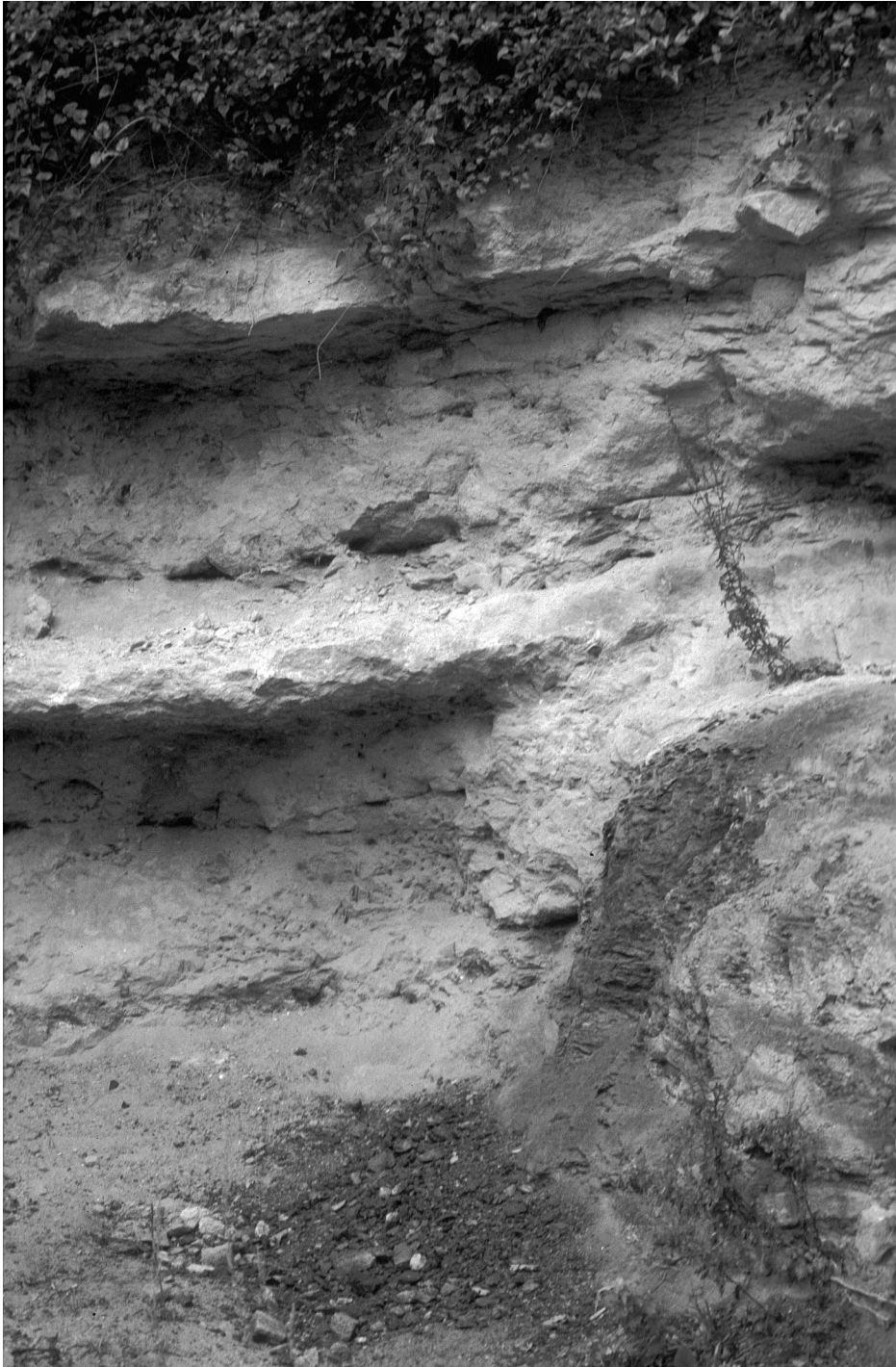
Abb. 4. Die egerischen Linzer Sande bei Plesching. Deutlich zu sehen das Relief des anstehenden Kristallins (rechts unten) und die verwitterungsresistente Austernbank (Bildmitte).

durch den Glaukonit- und Phosphoritgehalt grünlich-bräunlich gefärbt. Strandblockhalden deuten auf eine steile Felsküste hin. Die Sande sind besonders aufgrund des relativ häufigen Vorkommens von Haizähnen (meist Odontaspis spp.) gerade bei Hobby-Paläontologen beliebt. Etwa 20 Arten von Selachiern wurden bislang beschrieben (Schultz 1969), aber auch die Foraminiferenfauna (RÖGL 1969) und zahlreiche Makrofossilien sind bekannt (STEININGER 1966; PODZEIT & STEININGER 1969).