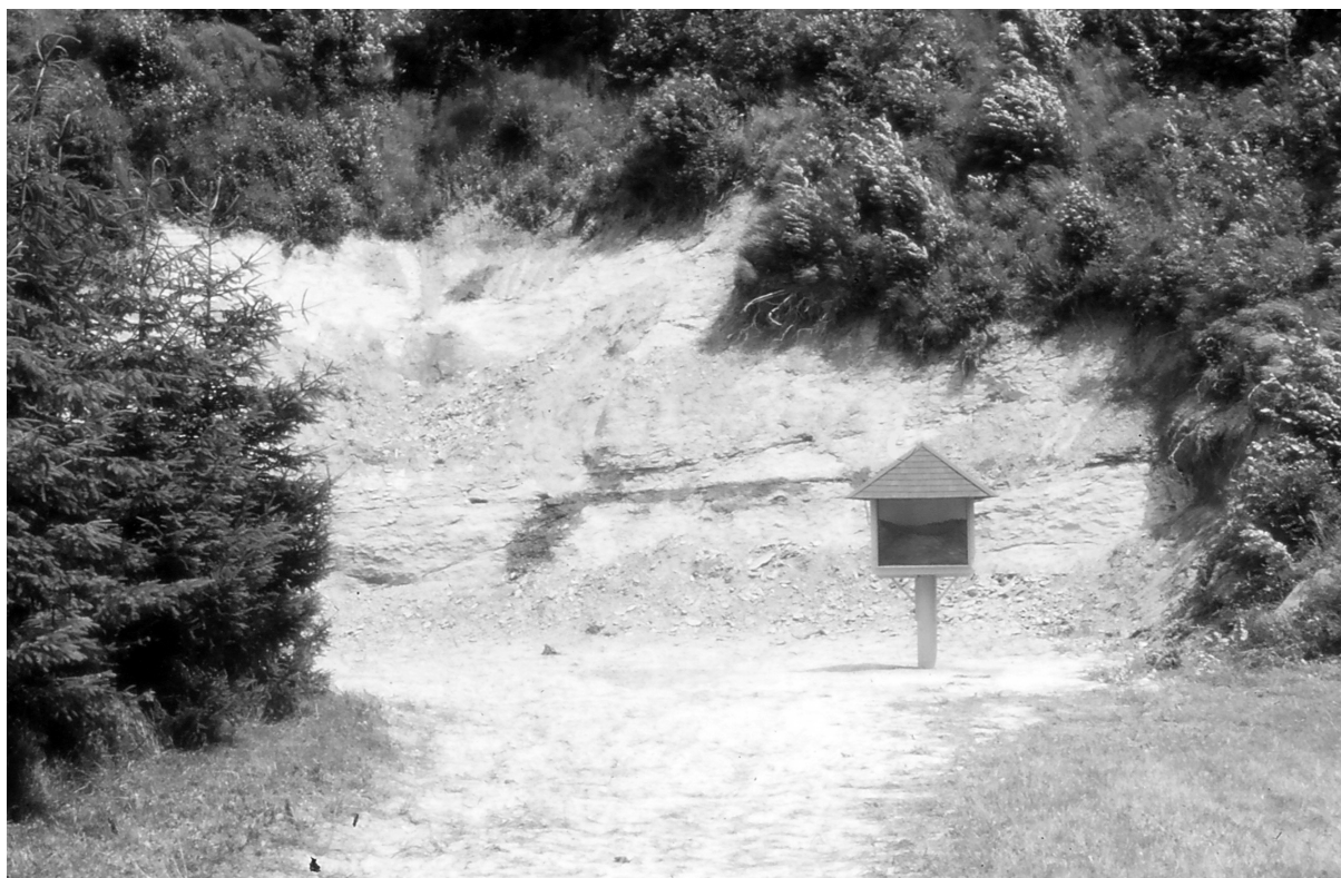
Abb. 2. Naturdenkmal und Stratotyp des Ottnangiums: die Ottnanger Schanze.

und eine Echinodermen-Species („ Spatangus “). MORIZ HOERNES' Sohn, RUDOLF HOERNES (1850-1912) legt 1875 eine umfangreiche Darstellung der Fauna des Schliers von Ottnang vor, illustriert mit 6 Tafeln (R. HOERNES 1875). Einige Foraminiferen werden bereits 1863 von AUGUST EMANUEL REUSS (1811-1873) beschrieben, die erste ausführliche Bearbeitung verdanken wir F. KARRER (1867). Auch der bedeutende bayrische Geologe („Geognost“) CARL WILHELM VON GÜMBEL (1823-1898) macht im Zuge seiner Studien in der Molasse seiner Heimat nicht bei den Landesgrenzen halt und beschäftigt sich eingehend mit dem Ottnanger Schlier (GÜMBEL 1888). In den 1970er Jahren wurde die Ottnanger Schanze dann als Stratotyp des Ottnangiums deklariert (RÖGL et al., 1973; RÖGL, 1975).