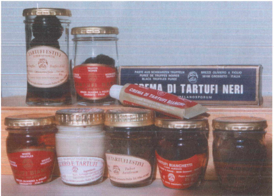
Abb. 2: Einige Produkte der Firma BREZZI.

Um die Belange der Trüffelhändler und der