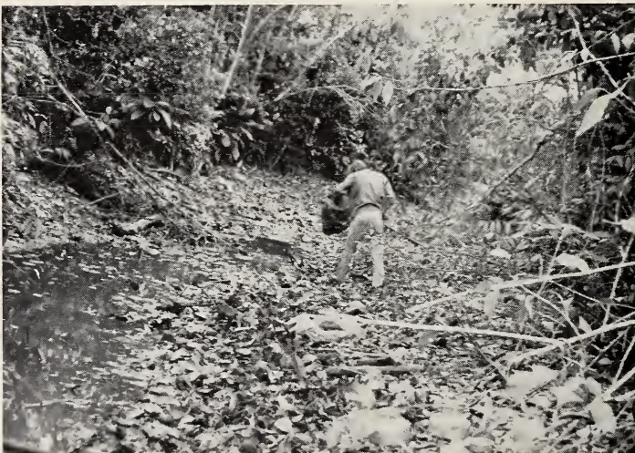
Abb. 2. (Biotop(-Ausschnitt) von Rivulichthys luelingi : flache, gesträuchumstandene Urwaldsenke mit klarem bis leicht trübem Flachwasser. Zur Niedrigwasserzeit sehr flach, meist unter einem halben Meter, mit reicher organischer Belastung (viele Äste und Baumstämme im Wasser, mäßig starker Laubfall — allochthone Substanzen); auf der Wasseroberfläche Pistia s p e c. und Wasserrosenblätter.