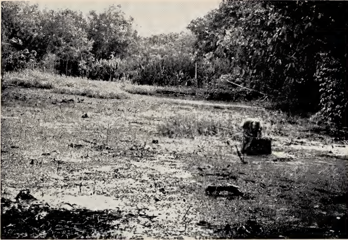
Abb. 3. Ein weiterer Biotop von Revolichthys luelingi : Stark verlandete Partie eines Altwasserarmes des Rio Chapare („Hoffmann Lagune“; Station „TS8“) bei Todos Santos, Ostbolivien, mit ganz flachem, nur wenige zentimetertiefem Wasser, das fast lückenlos mit Azolla filiculoides bedeckt ist.

Beschreibung: Körper gestreckt, vorne walzlich, etwa ebensobreit wie hoch, nach hinten zu seitlich etwas zusammengedrückt, die untere Schwanzstielkante aber nicht blattartig. Kopf etwas breiter als hoch, die Kopfhöhe 1,05—1,15mal in seiner Breite. Körperhöhe in der Gesamtlänge (inkl. Caudale) 5,7—5,85mal, in der Körperlänge 4,5—4,7mal enthalten; die Kopflänge in der Gesamtlänge etwa 3,9—4,3mal, in der Körperlänge 3,2—3,4mal. Auge groß, erreicht oben das Frontale, in der Kopflänge nur 2,6—2,7mal enthalten, in der Schnauzenlänge 0,5—0,6mal, in der Interorbitalbreite 1,15—1,25mal, Schwanzstiel kurz, seine Höhe 1,1mal in seiner Länge.