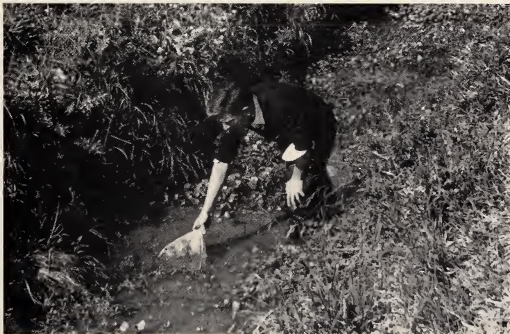
Abb. 1. Stark verkrauteter, eutrophierter Graben mit leicht milchig grauem Wasser; Biotop von Cnesterodon decemmaculatus in der Provinz Buenos Aires (Argentinien)

Nur wenige Schritte von meiner Unterkunft im September/Oktober 1970 zieht sich hinter dem Gelände der San-Salvador-Universität (Instituto Latino Americano de Fisiología y Reproducción „ILAFIR“) bei dem Vorort San Miguel ein etwa 3—4½ m breiter, stark verkrauteter Entwässerungsgraben durch ebenes, mit Gras bewachsenes Gelände. Wenn ich mit einem breiten Handnetz in nur wenigen und kurzen Schüben zwischen den Sumpfpflanzen in das seichte Wasser griff, hatte ich augenblicklich den Boden des Netzes voll von silbrig blitzenden Cnesterodon decemmaculatus (Abb. 1): so dicht zusammengedrängt lebt dort diese Fischart in der Zeit des fallenden Wassers.