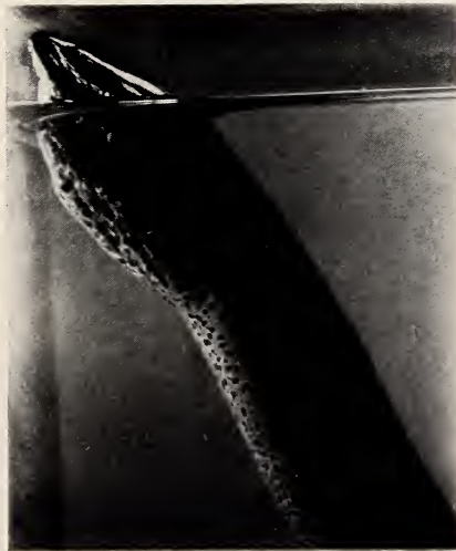
Abb. 4. Synbranchus marmoratus mit geschwollener Rachen- und Kiemenregion bei der Aufnahme atmosphärischer Luft vom Wasserspiegel

(übrigens neben der Kiemenatmung — die Kiemenblättchen sind sogar auch an Land im Feuchten funktionsfähig: eine große Ausnahme bei Fischen! —) in der dehnbaren Rachenhöhle atmosphärische Luft. Es ist sicher, daß manche Cnesterodon , besonders auch die größeren trächtigen Weibchen, von heranwachsenden Kurzschwanztaalen gefressen werden.