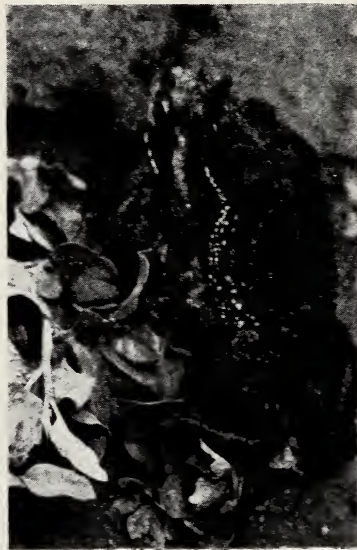
Abb. 5. Copula von Bufo arenarum in ganz flachem, leicht trübem Grabenwasser (Provinz Buenos Aires; Mitte Oktober 1970)

In der Nacht vom 16. zum 17. Oktober 1970 gingen unter starken Gewittern außerordentlich starke Regenfälle über die Provinz Buenos Aires nieder, nachdem es Tage vorher tagsüber sehr trocken und sonnig gewesen war. Ein heftiger, fast explosionsartiger Paarungstrieb erfaßte die Kröte Bufo arenarum . In zahlreichen Exemplaren zog sie aus der Sumpfvegetation über Land zum Teil auf einen künstlichen Wassergraben zu, der rings um das turmartige Gebäude des Astronomischen Observatoriums der San-Salvador-Universität angelegt ist. Dort im Wasser erscholl dann, selbst noch in der Helligkeit des Morgens, der laute trommelnde Paarungsruf der Kröten aus kuglig aufgeblasenen Kehlen. Kopulierende Krötenpaare waren noch stundenlang am frühen Vormittag im Wasser zu sehen (Abb. 5), und von den Goldfischen, die in diesem künstlichen, ausbetonierten Graben ausgesetzt waren, mußten zwei mittelgroße Tiere ihr Leben lassen: sie wurden in blinder Fehlkopulation zu Tode geritten! Es war leicht, diesen Paarungsrausch von Bufo arenarum (mitsamt den zwei geschundenen Goldfischen) zu photographieren. —