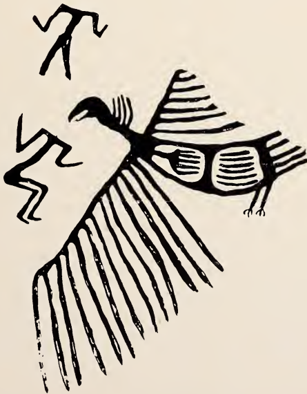
Abb. 4. Ausschnitt aus der Szene von Geierschrein VII 8. Aus Mellaart 1967.

Nun haben wir für den Archäologen noch eine weitere Anregung. Auf Abb. 2 sehen wir zwischen den beiden Geiern außer (mindestens) einer kopflosen Leiche einen lebenden Menschen, der in der einen Hand eine „sling“ (= Schleuder) schwingt — so deutet dies der Verfasser, und er vermutet, daß hier Angriffe des Geiers abgewehrt werden sollen. Es könnte sich jedoch nur um ein Vertreiben von den Leichen handeln, denn Geier greifen niemals einen sich bewegenden Menschen an. Aber muß es überhaupt eine Abwehr sein? Wir erinnern uns, daß E. Schäfer — der dies freundlicherweise im Brief bestätigt — in einem Tibetfilm (hergestellt von der Tobis 1942) Peitschenschwinger zeigt. Frau Taring (1972) spricht freilich davon, daß die zu Hunderten „diszipliniert“ wartenden Geier erst dann nahekommen, wenn sie „gerufen“ werden, und auch Hedins Leute lassen „einen Lockton erschallen“. Der Film von E. Schäfer beweist aber, daß (in diesem Fall) die Geier auf ein Peitschenschwingen der berufsmäßigen Leichenzerschneider (Ragyapas) herankommen; der Peitschenschwinger ist dann rings von Geiern umgeben, die sich um die zerstückelten Leichen streiten. Danach kann man Geier also sowohl auf Zuruf als auch auf Peitschenzeichen dressieren; die geschwungene Peitsche wirkt wie das vom