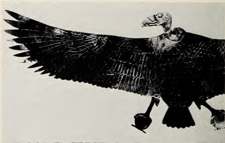
Abb. 1. Geier-Pektorale aus dem Grab dreier Prinzessinnen von Thutmosis III (15. Jahrhundert v. Chr., 18. Dynastie, Deir-el-Bahari); Teilbild. Offensichtlich ist hier ein Ohrengeier ( Torgos tracheliotus ) dargestellt. (Aus Grossmann & Hamlet, nach H. E. Winlock, The Treasure of three Egyptian Princesses , New York 1948).

phen: Das Zeichen a (aleph) wird eindeutig vom Schmutzgeier dargestellt, die Konsonantengruppen mwt, mut und nr(ner) vom Gänsegeier (Griffith 1898). Ein dünnschnäbliger, gleichmäßig brauner Geier (siehe Moreau 1930) ist leicht als Schmutzgeier im Jugendkleid zu verstehen; indes kann man die Deutung als (auf die Tropen beschränkten) Kappengeier ( Necrosyrtes monachus ) nicht ganz abweisen. In einigen Fällen zeigen ausgesprochene Dickschnäbler eine auffallende, schuppige Strukturierung der Flügeldecken; der Verdacht auf Sperbergeier ( Gyps rueppelli ) anstatt Gänsegeier liegt nahe, ist aber nicht zu bekräftigen. Dagegen spricht der ausgeprägte Wulstkopf eines Pektorale aus der Zeit von Thutmosis III. recht deutlich für den Ohrengeier ( Torgos tracheliotus ) (Abb. 1); diese Art kommt in kleiner Zahl noch heute nordwärts bis zum Toten Meer vor. Mönchsgeier ( Aegyptius monachus ) und Bartgeier ( Gypaetus barbatus ) lassen sich in der ägyptischen Tradition anscheinend nicht nachweisen.