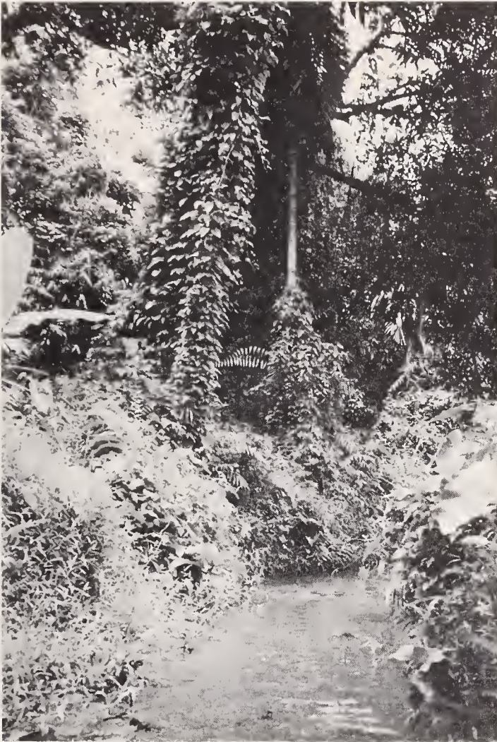
Abb. 4: Der Bach, in dem die Maulbrüter leben, aus der Nähe ( Betta pugnax ; Fundort 6).

Abweichend von den Angaben in Tabelle 1 fand ich im Subang Forest Reserve Betta pugnax auch in Wasser mit einer Temperatur von 27—28° C. Es war ein unbeschatteter Quellsumpf, aus dem ein ebenfalls mit Betta pugnax bevölkerter Bach entsprang. Der Bach hatte mittelstark strömendes Wasser und einen kiesig-sandigen Boden, enthielt nur sporadisch Pflanzen, aber viel abgestorbenes Laub von den Bäumen. Zwischen den Blättern hielten sich neben bunten Kaulquappen, vereinzelt Schlangenkopffischen ( Channa orientalis ), verschiedenen Barben- und Rasbora -Arten einige ausgewachsene, viel häufiger aber kleine, nur 0,5 bis 1 cm große Betta pugnax auf. Die Jungbettas fing ich ebenso häufig im Quellsumpf.