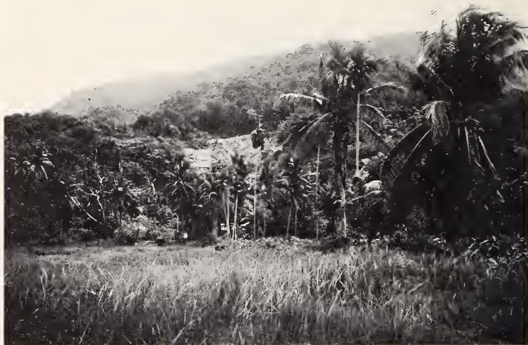
Abb. 3: Für beide Kampffische typische Lebensräume. In den warmen Stillwasser-Pfützen des Reisfeldes im Vordergrund leben Kleine Kampffische ( Betta imbellis ); dort, wo am Rand des Berglandes die Bäche der Ebene zufließen, lebt der Maulbrütende Kampffisch ( Betta pugnax ). Das Foto zeigt Fundort 6 in Abb. 1–2.

befindlichen Zinngrube gehört und hier Spülwasser eingeleitet wird. Doch zeigt dieses, welche extreme Anpassungsfähigkeit diese Tiere im Hinblick auf den Säurewert aufweisen. Im Hinblick auf die Wassertemperatur scheinen die Ansprüche deutlich enger zu sein. Ich habe sie nie in Wasser gefunden, das kühler als 28^{\circ}\text{C} ist. Das erklärt ihre Vorliebe für offene, unbeschattete Flachwasserzonen. Im fließenden Wasser der Urwälder und Kautschukplantagen trifft man sie nur selten an, weil das Wasser hier normalerweise kühler als 28^{\circ}\text{C} ist.