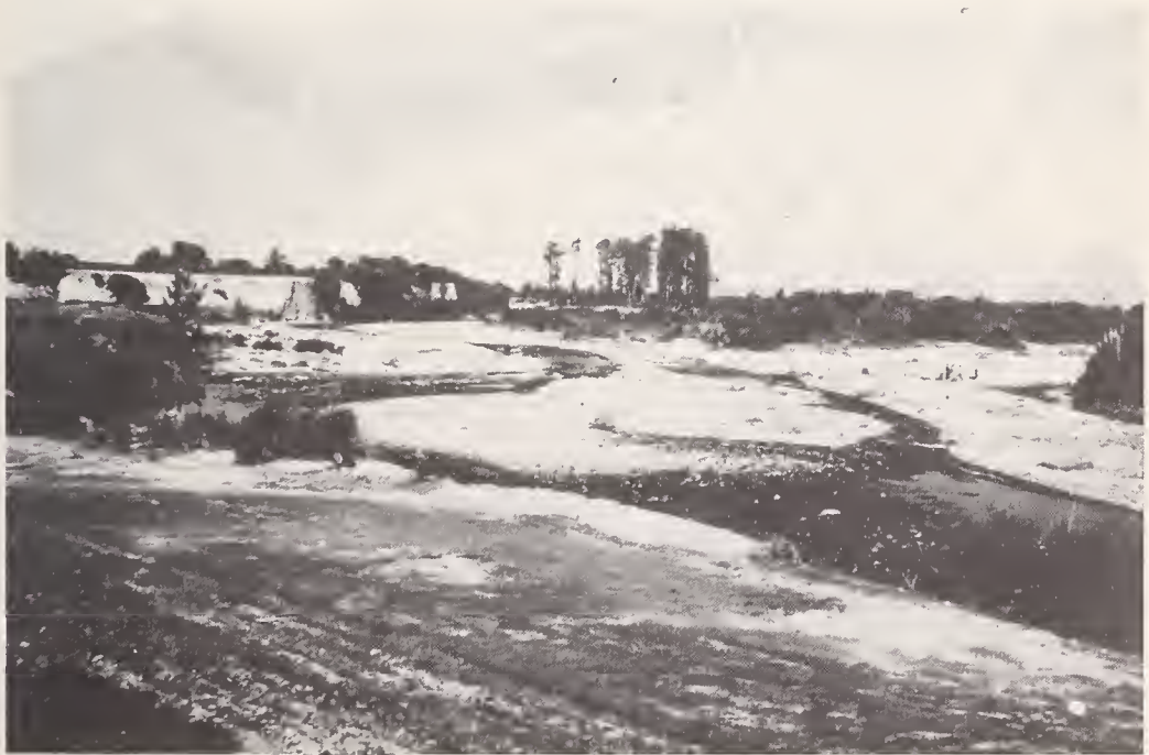
Abb. 2: Talaue des Río Lurín. Blick flußabwärts vom „Trogshutterweg“ nach WSW.