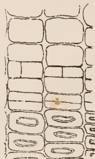
Fig. 8. Pinus silvestris . Winterstadium. Querschnitt durch die Cambiumgegend. Radiale Teilungen der Initiale. Vergröss. 250.

Ich lasse hier die Beobachtungen über die Zunahme eines Stammes von Pinus silvestris mit schwacher Jahrringbildung folgen.