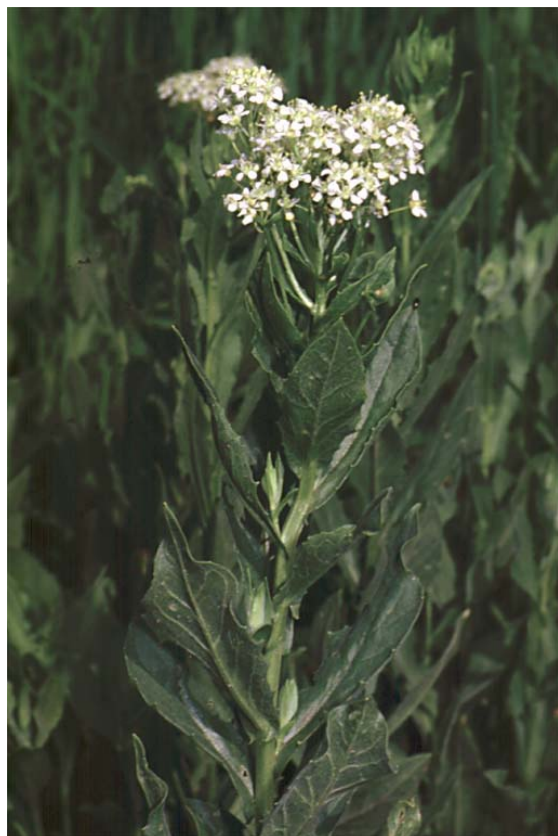
Abb. 5: Cardaria draba (Pfeilkresse).