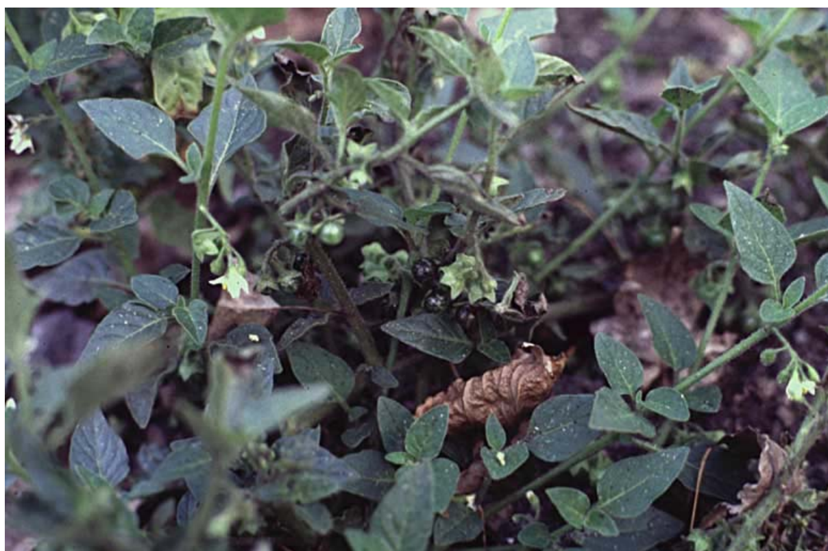
Abb. 14: Solanum physalifolium ssp. nitidibaccatum (Argentinischer Nachtschatten).