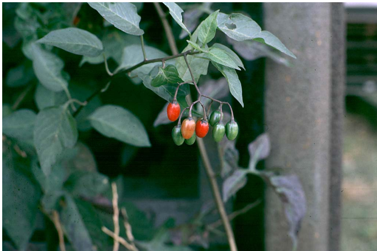
Abb. 13: Solanum dulcamara (Bittersüßer Nachtschatten).