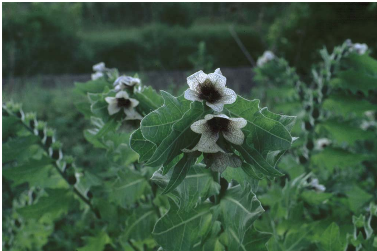
Abb. 7: Hyoscyamus niger (Schwarzes Bilsenkraut).