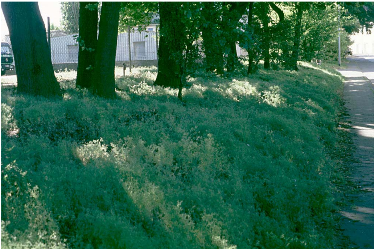
Abb. 4: Dominanzbestände von Anthriscus caucalis (Hunds-Kerbel) an einer Böschung im Halbschatten von Bäumen im Spätfrühling.