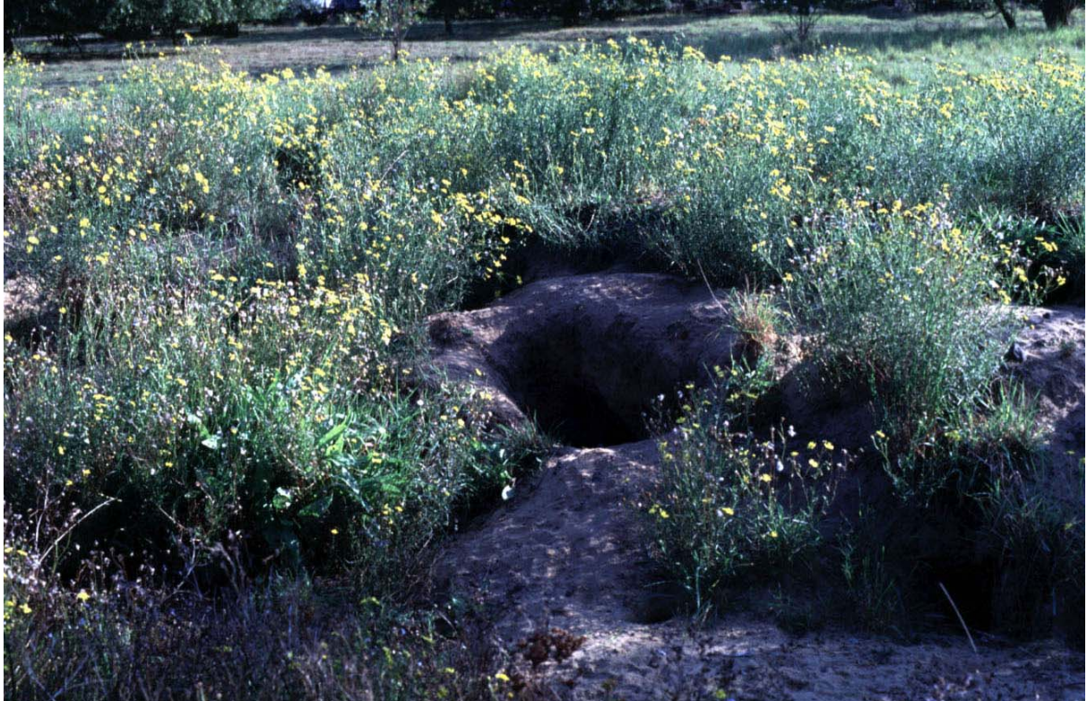
Abb. 11: Senecio inaequidens (Schmalblättriges Kreuzkraut) an Kaninchenbauten zwischen Hafenbahn und Hansestraße.