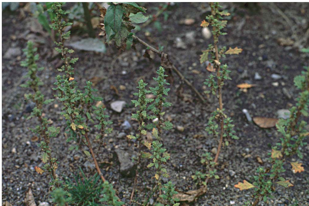
Abb. 6: Chenopodium pumilio (Australischer Gänsefuß).