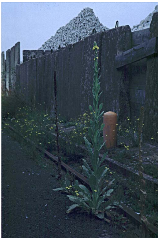
Abb. 16: Verbascum thapsus (Kleinblütige Königskerze).