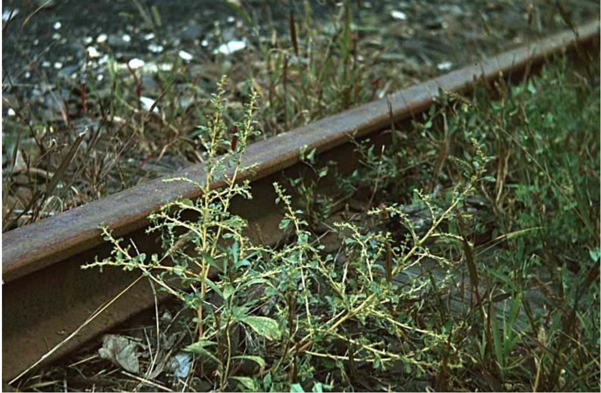
Abb. 3: Amaranthus albus (Weißer Gänsefuß).