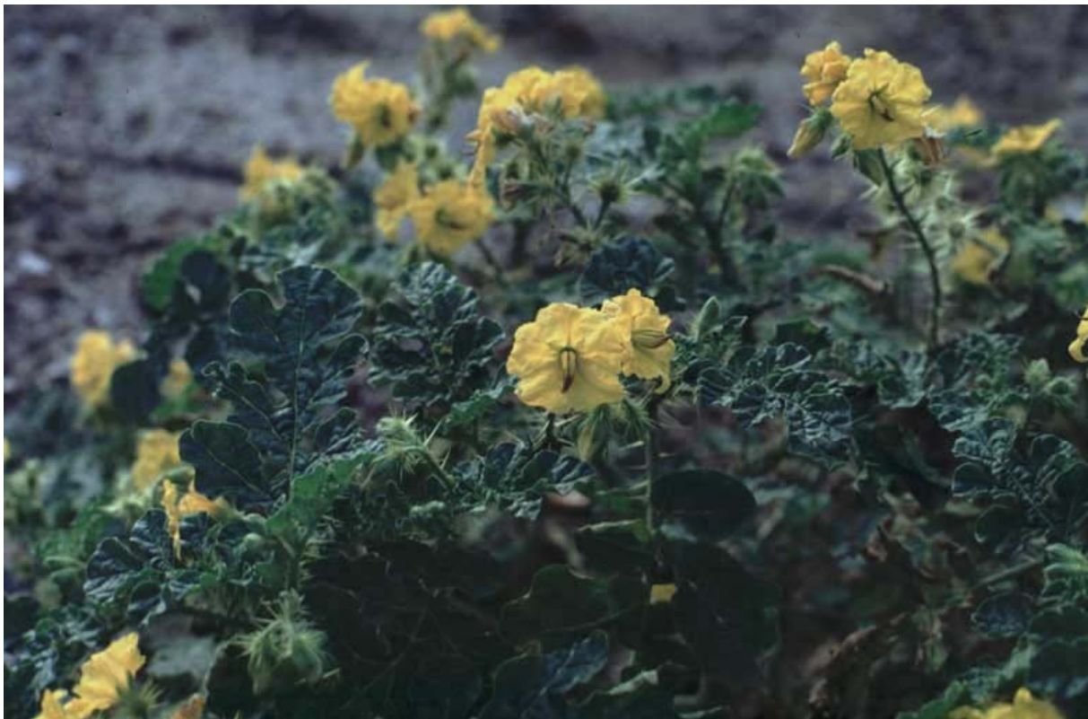
Abb. 12: Solanum cornutum (Stachel-Nachtschatten).