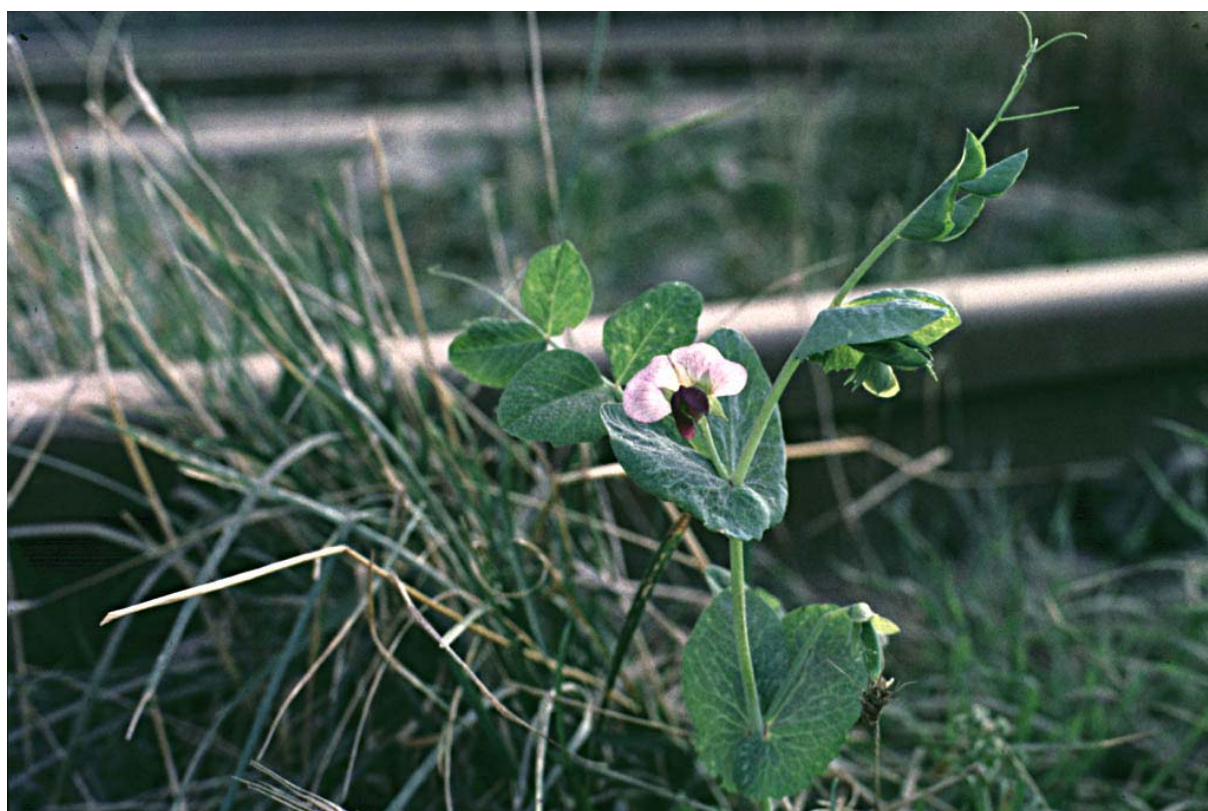
Abb. 8: Pisum sativum (Erbse).