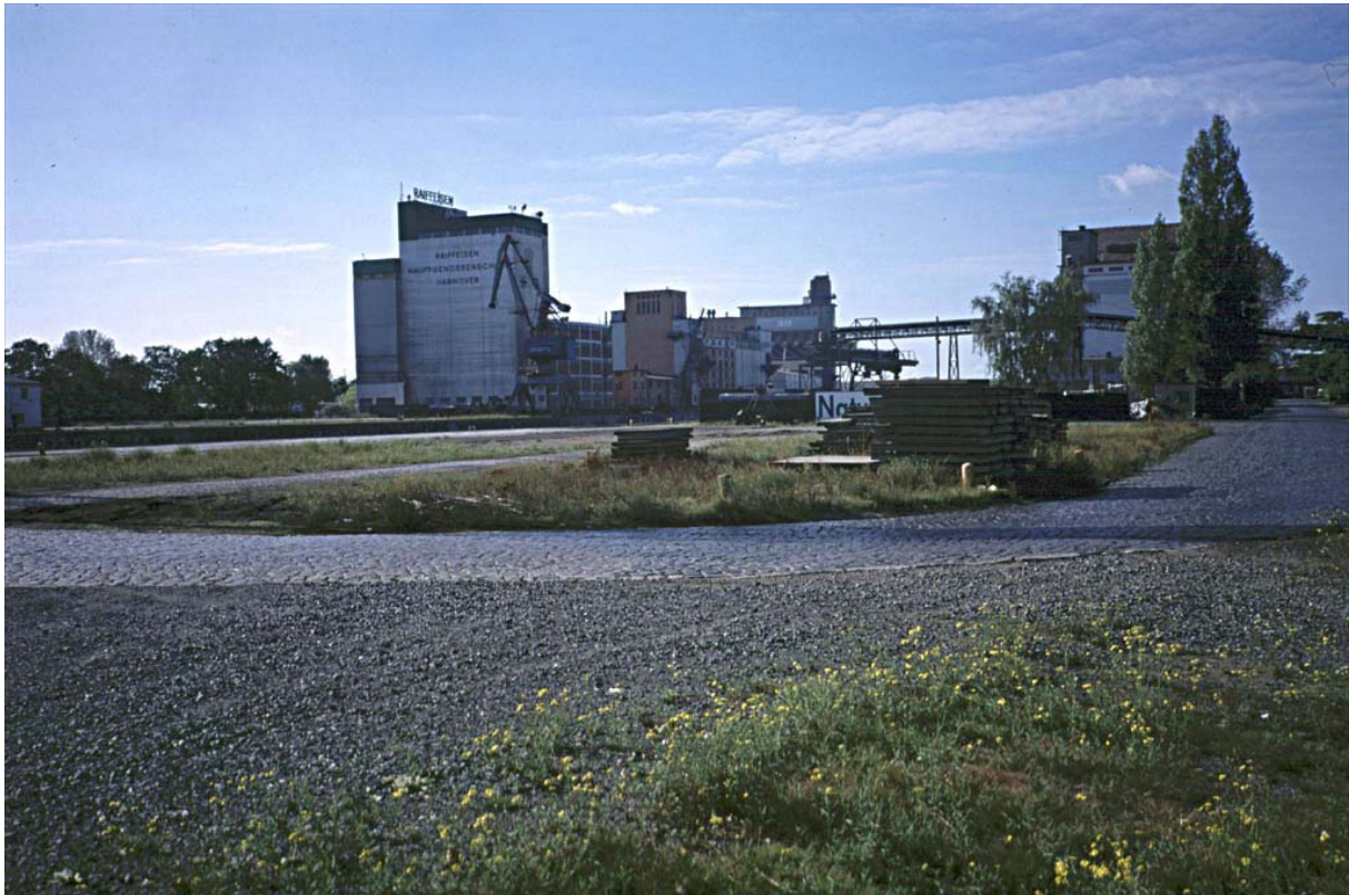
Abb. 1: Blick von Osten auf das Hafengelände.