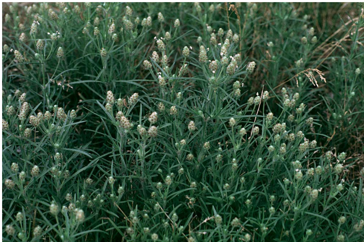
Abb. 9: Psyllium arenarium (Sand-Flohsame).