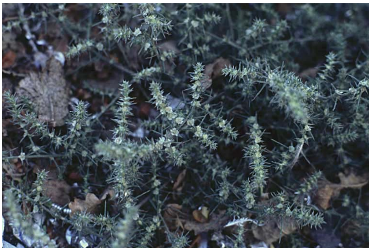
Abb. 10: Salsola kali ssp. tragus (Ungarisches Salzkraut).