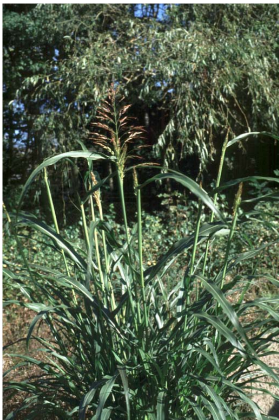
Abb. 15: Sorghum halepense (Mohrenhirse).