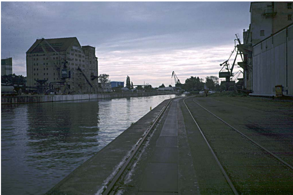
Abb. 2: Blick auf das Hafenbecken von Nordwesten.