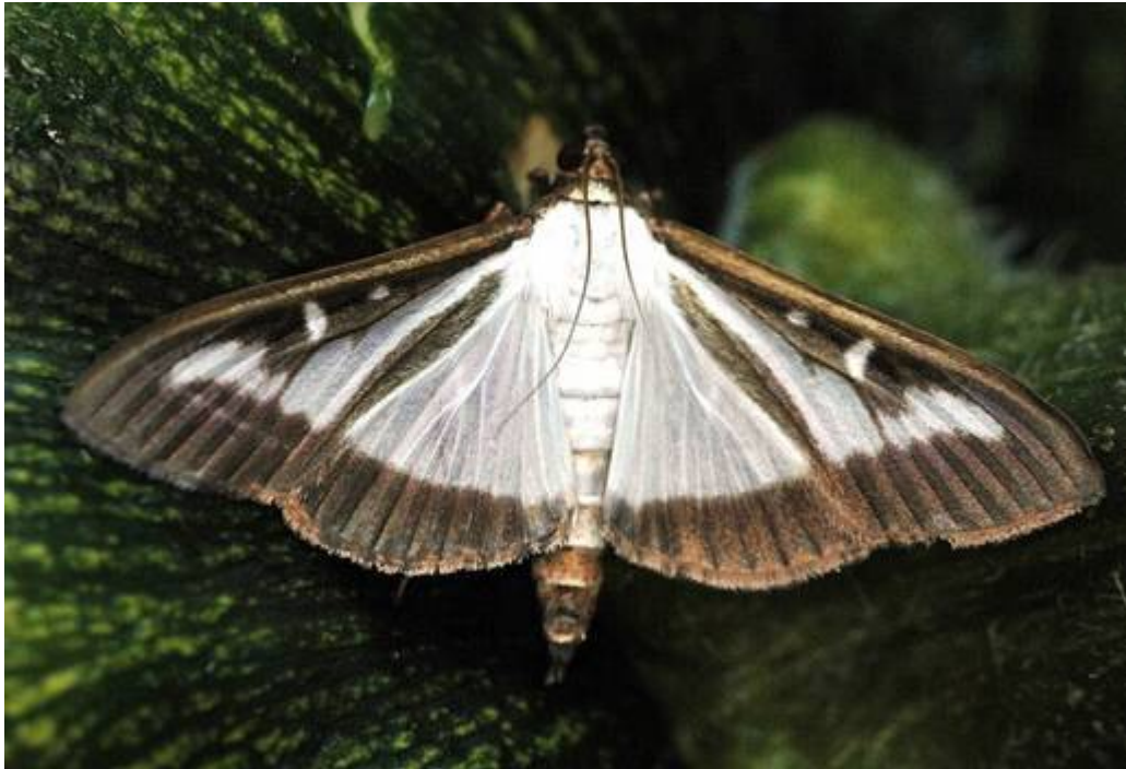
Abb.1: Der Buchsbaumzünsler in seiner häufigeren Farbvariante. Es gibt aber auch fast völlig schwarze Exemplare. Spannweite um 40 mm

pflanzung Schadbilder des Buchsbaumzünslers festgestellt werden. Diese waren nur wenig ausgeprägt, was auf einen relativ jungen Befall schließen lässt. Das ganze Ausmaß wird sich