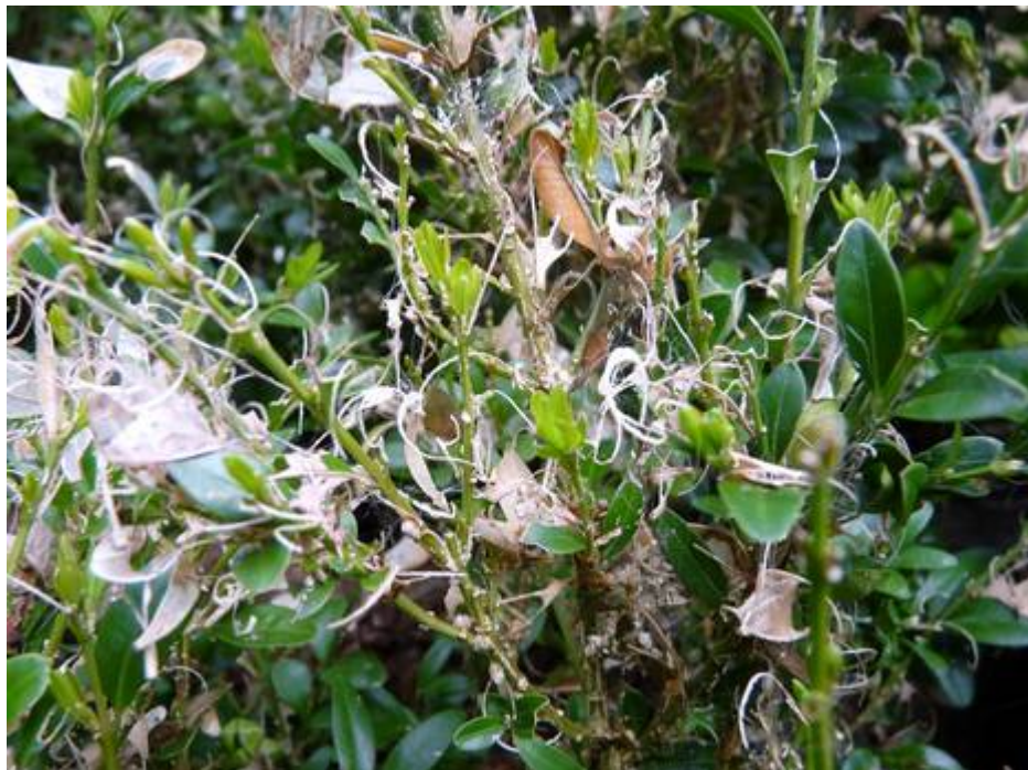
Abb.3: Das typische Schadbild bei Befall durch den Buchsbaumzünsler (Gendorf am 29.IX.2010)