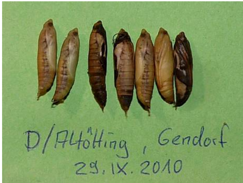
Abb.2: Puppen des Buchsbaumzünsler die neben zahlreichen Puppenhüllen bei Gendorf gefunden wurden (29.IX.2010 Leg.: Walter Sage).