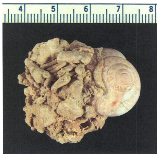
Abb. 1: Arianta arbustorum (LINNAEUS 1758): Eibenmühlenhöhle.