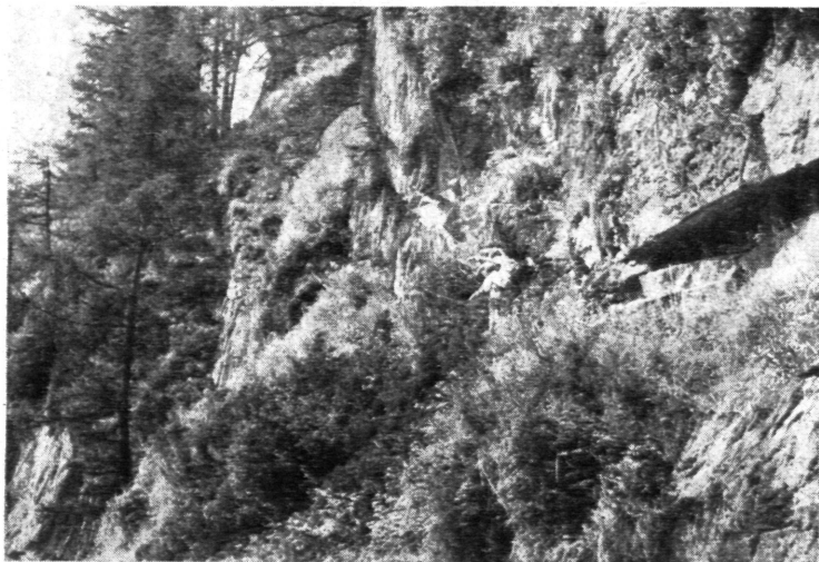
Prasinit-Wand nördlich der Pebellalpe im Umbaltal, in der Bildmitte der Fundort der Japaner-Zwillinge von Bergkristall

Nebenbei bemerkt, gilt die Umgebung der Pebellalpe, besonders der Fundort, als Kreuzotterneldorado, Besuchern wird also größte Vorsicht empfohlen.