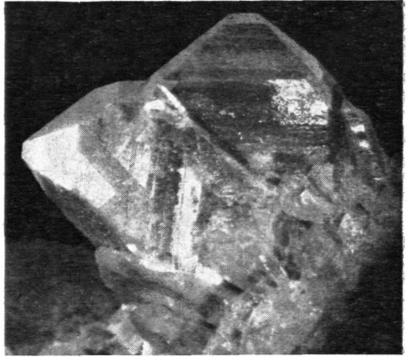
Japaner-Zwilling 2fach vergrößert