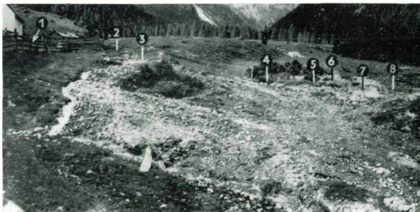
Abb. 2: Übersicht über das breite Tal beim Tuffbad mit Eintragung der acht Quellaustritte im Gelände; in der linken oberen Bildecke die Kapelle beim Almgasthof und rechts hinter ihr die Hütten des Almdorfes. (Photomontage aus 2 Weitwinkel-aufnahmen von Prof. SCHEMINZKY, 1955.)