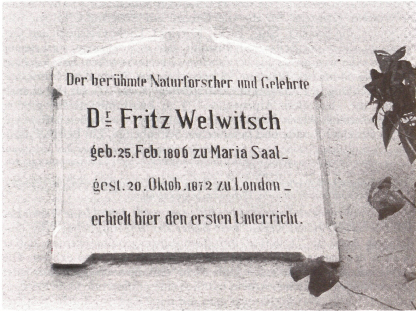
Abb. 3: Gedenktafel in Maria Saal.

Auflistung, eine Aneinanderreihung von Pflanzennamen aus. Vieles habe er „vorsätzlich nicht angeführt, weil selbes ein Gemeingut größerer Bezirke ist und folglich nicht zu den charakterisierenden Eigen- oder Seltenheiten dieser Plätze gezogen werden darf“ (82) .