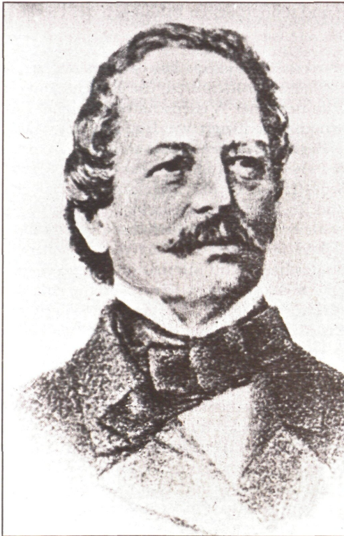
Abb. 1: Friedrich WELWITSCH (1806–1872), Photo auf Karton (Rs.: Alois Beer, k. k. Hof-Photograph Klagenfurt, Carte de visite), im Besitz der Bibliothek des Landesmuseums für Kärnten in Klagenfurt.