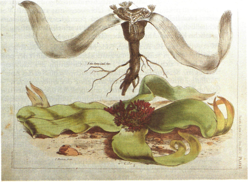
Abb. 2: Illustrationen der ersten Publikation zur WELWITSCHIA (vgl. Joseph Dalton HOOKER, On Welwitschia, a new Genus of Gnetaceae. In: The Transactions of Linnean Society of London XXIV, London 1863, Tab. 1, 4, 7).