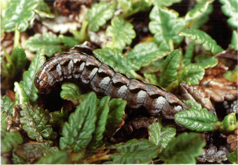
Abb. 3+4: Erwachsene Raupen an ihrer Futterpflanze Dryas octopetala .