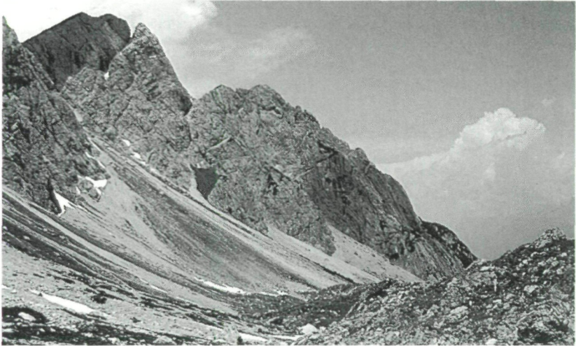
Abb. 1: Kalk-Geröllhalden in den Lienzer Dolomiten: Flugplatz von S. nigrita B.

An folgenden Pflanzen konnte ich S. nigrita saugend beobachten: Dryas octopetala (Silberwurz), Silene acaulis (Stengelloses Leimkraut), Potentilla nitida (Dolomiten-Fingerkraut).