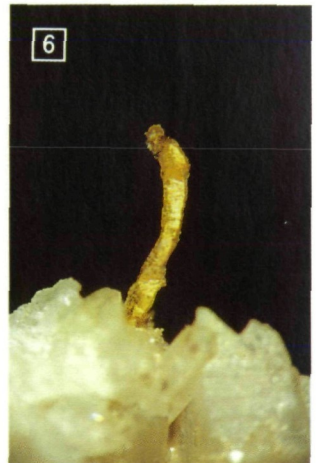
Bild 1: Schareck mit Wurtenkees. Bild 2: Das Quarzband am Wurtenkees. Bild 3: Gediegen Gold, 2 Kristalle an der Spitze verwachsen, Bildbreite 8 mm. Bild 4: Gediegen Gold als Umhüllung von Tetradymit, Bildbreite 6 mm. Bild 5: Montanit auf Tetradymit, Bildbreite 8 mm. Bild 6: Gediegen Gold, Kristallgröße 4 mm.