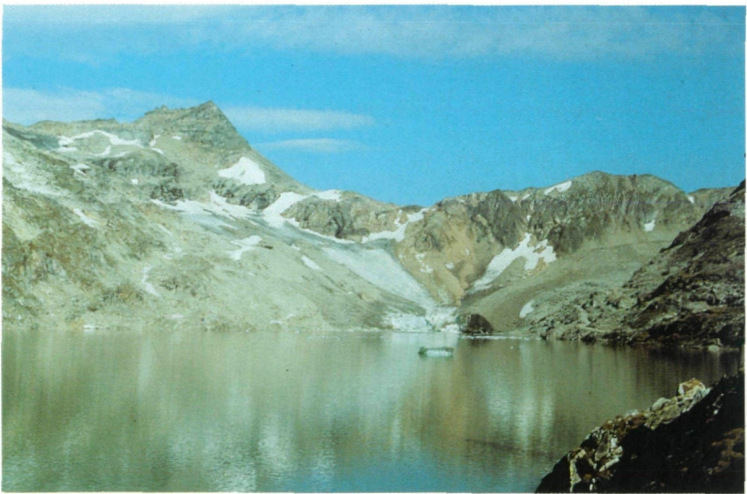
Abb. 1: Alteck mit Wurtenkees.

Lage: Das Quarzband liegt in ungefähr 2450 m Höhe am östlichen Rand des Wurtenkeeses unter dem Schareck, Hohe Tauern, in Kärnten in der Nähe eines ähnlichen Vorkommens, das der Salzburger Minerali-