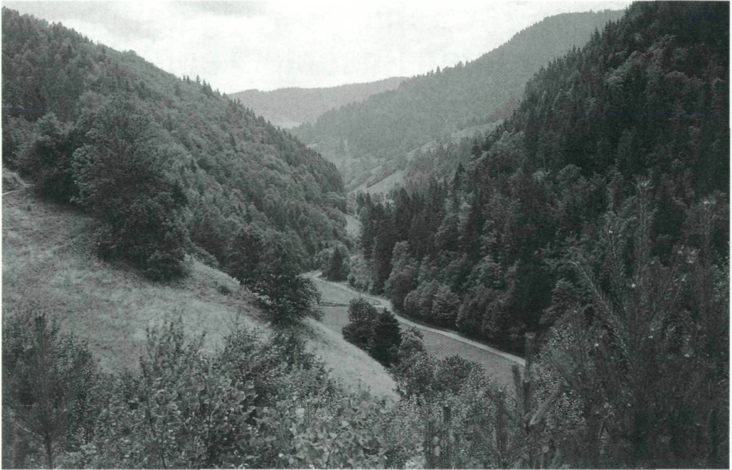
Abb. 1: Blick vom Motschulberg in den Motschulagraben.