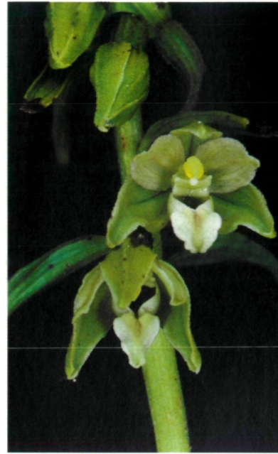
Abb. 3: Epipactis helleborine subsp. orbicularis, Blütenbau einer Pflanze mit vollsonnigem Standort, Mieger, 28. 6. 1998

Der Stengel von Epipactis helleborine subsp. orbicularis ist gerade und meist, auffallend besonders auch im