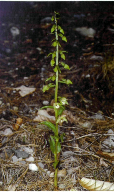
Abb. 2: Epipactis helleborine subsp. orbicularis, Habitus in einem süd-exponierten Rotföhren - Pionierwald, halbschattig, Miegler, 28. 6. 1998

Die doch recht große Variabilität in Bezug auf die vegetativen Organe der Individuen innerhalb der Populationen in Kärnten (Färbung, Wuchsgröße, Blattform und -stellung), die durch die Abbildungen dokumentiert werden soll, machte neben Literaturstudien für eine klare Stellungnahme zusätzlich Vergleiche mit anderen, dem Taxon Epipactis distans Arvet-Touvet zugeordneten Pflanzen in Tirol und Niederösterreich im Feld unumgänglich – dabei fiel auf, daß auch hier zwischen den Individuen (und den Populationen) doch einige morphologische Variabilität herrschte. Dennoch kristallisierte sich ein recht typischer Merkmalskomplex, gekennzeichnet durch Gemeinsamkeiten in Wuchsform, Färbung und Bau der vegetativen Organe, Blütezeit und ökologischen Ansprüchen heraus, der eine einheitliche systematische Bewertung dieser xerophilen Epipactis – Populationen rechtfertigen dürfte, wobei in diesem Artikel die Einstufung als Unterart – Epipactis helleborine subsp. orbicularis (Richter) Klein – bevorzugt wird.