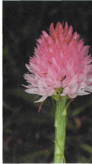
Abbildung 3: Nigritella lithopolitana, Blütenstand. Hochobir, 21. 6. 1998