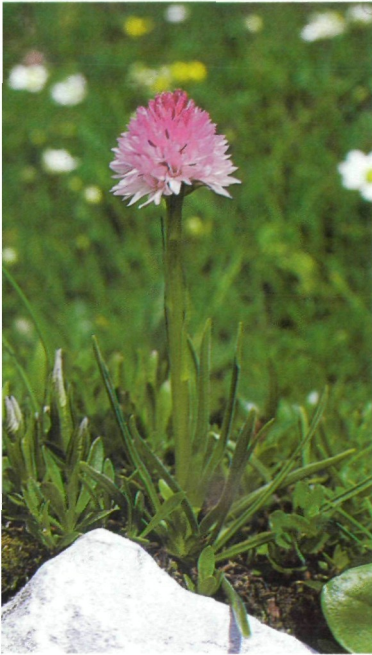
Abbildung 2: Nigritella lithopolitana, Habitus. Petzen, 12. 7. 1991

tria and Slovenia), the mountains of Kamniške and Savinjske Alpe (Slovenia) and Koralpe (Styria). After a short description of this orchid species the hitherto known places of occurrence of the plant in Carinthia, complemented with some records for Styria and Slovenia (from literature or from the herbarium KL), are listed. The actual distribution area of Nigritella lithopolitana is shown in a map.