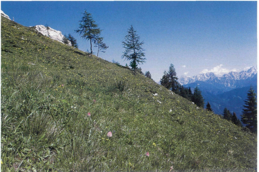
Abbildung 1: Typisches Biotop mit Nigritella lithopolitana am Hochobir, 14. 6. 1996

Ta članek se ukvarja s razširjenosti Kamniške murke ( Nigritella lithopolitana RAVNIK) na Koroškem, orhideja, endemične vrste vzhodnih Karavank, Kamniških in Savinjskih Alp ter Štajerske Golice. Rastlina je kratko opisana. Znaša najdbišča na Koroškem so navedene. Nadaljno so navedene znana najdbišča Slovenije in Štajerske v tem prispevku. Zemljevid dokumentira razširjenost Kamniške murke.