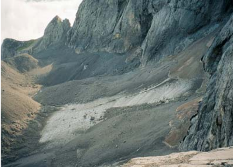
Abb. 7: Blick auf den Eis- scheitel sowie den östlichen Gletscher- teil im Rekordsom- mer 2003. Bis auf ein paar mit Saha- rastaub bedeckte Altschneefelder liegt im August kein Schnee am Gletscher.

Bild nur mehr in seinen Extremwerten. Die Monate April, Mai und Juni bringen es im Mittel auf positive Abweichungen von bis zu 2,1 K (Juni), vgl. Tabelle 2, September und Dezember bleiben etwas zu kühl.