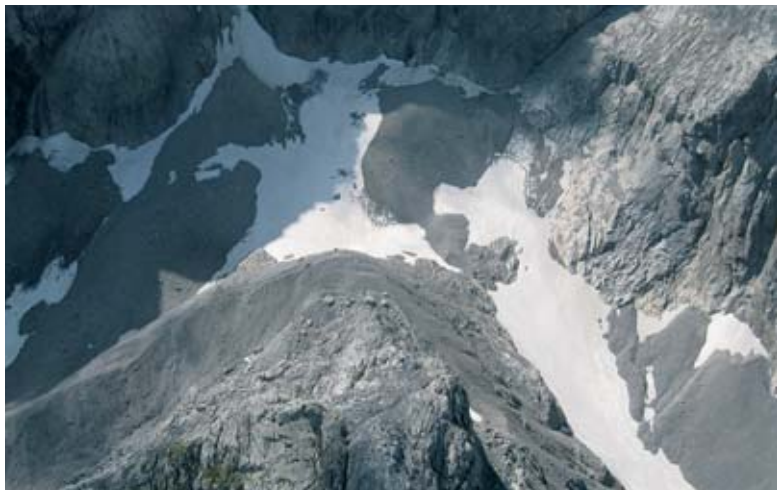
Abb. 6: Am 18. 8. 2008 finden sich am Gletscher noch keine Blankeistellen. Im rechten Bildteil kann man bereits sehr gut den schmalen Zungenansatz erkennen.

Das Gletscherjahr 2007/08 verlief entgegen den Erwartungen für das Eiskar durchaus positiv. Nach einem trockenen Herbst brachte ein kräftiges Adriatief um den 24. 11. 2007 bis zu 2 m Neuschnee. In den folgenden Tagen ging eine mächtige Lawine auf den Gletscher nieder. Bis Feber kam es wiederholt zu leichten bis mäßigen Schneefällen im Eiskar. Entscheidend in diesen Monaten war aber das Ausbleiben von Nordwinden nach den Schneefällen, wodurch der Neuschnee am Gletscher liegen blieb und nicht aus der Karmulde verfrachtet wurde. Die Monate März und April brachten bei durchschnittlichen Temperaturen wiederholt Schneefälle von mäßiger Intensität. In der letzten Maidekade transportierte eine kräftige Südwestströmung Saharastaub in den Alpenraum und sorgte für die erste Hitzewelle im Jahr 2008, Schnee fiel in diesem Monat nur mehr einmal um die Monatsmitte. Der Juni begann kühl und feucht und am 13. 6. 2008 schneite es nochmals 5–10 cm. In der zweiten Junihälfte sorgte eine zweite Hitzewelle für starke Schneeschmelze im Eiskar. Juli und August verliefen warm und feucht, weitere Hitzeperioden blieben aber aus. Einzelne Kaltluftvorstöße sorgten zwar für Abkühlung, es kam aber zu keinen Schneefällen im Eiskar.