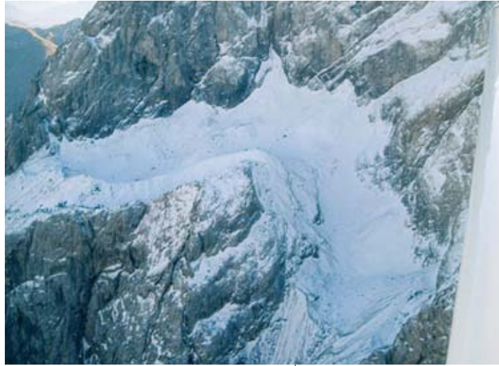
Abb. 8: Im Herbst liegt das Eiskar den ganzen Tag über im Schatten.

Bei der Auswertung der Temperaturdaten der letzten 15 Jahre (1992–2007) zeigt sich ein ganz klarer Trend. Gerade die für das Eiskar so wichtigen Monate April, Mai und Juni weisen eine deutlich positive Temperaturabweichung zum langjährigen Mittel (1971–2000) auf. Der