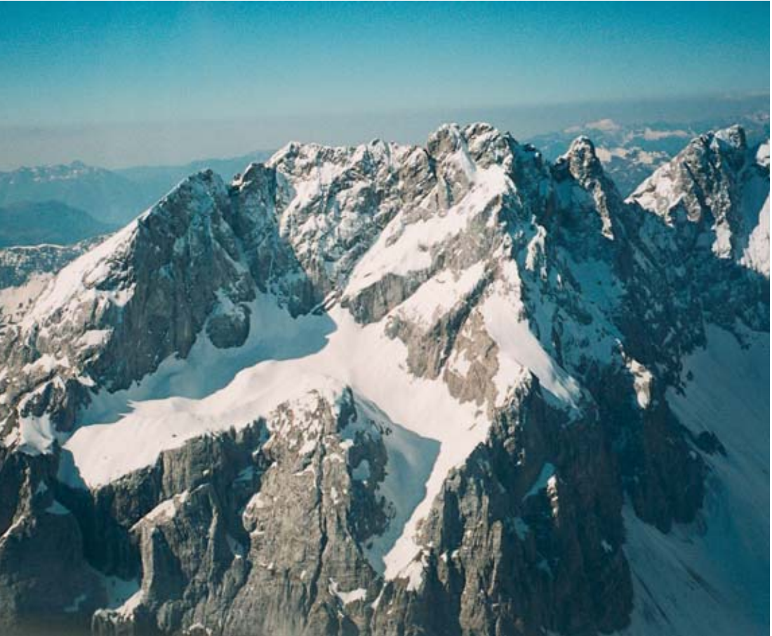
Abb. 1: Blick von Norden auf die Kellerwand und das Eiskar, aufgenommen am 30. 5. 2004.

Nach Süden hin wird der Gletscher von der mächtigen rund 400 m hohen Oberen Kellerwand umrahmt, an deren Wandfuß auch der mit rund 2.370 m höchste Punkt des Eiskars liegt. An seinem nordöstlichen Rand begrenzt ein rund 30 m hoher Moränenwall den Gletscher, in seinem westlichen Abschnitt endet das Eiskar in einer schön ausgebildeten Gletscherzunge in nur 2.115 m Seehöhe. Die besonderen Gunstmomente für die Existenz des Gletschers in derartig niedriger Seehöhe bilden neben der starken Beschattung durch die südlich des Gletschers aufragenden Felswände noch die hohen Niederschlagsmengen in fester Form und vor allem die häufigen nach kräftigen Schneefällen auf den Gletscher niedergehenden Lawinen. Somit zählt das Eiskar, welches aktuell (2008) eine Fläche von rund 16 ha aufweist, zum Typus eines Lawinengletschers. Der nach schneereichen Wintern im Kar abgelagerte verdichtete Lawinenschnee schmilzt im Sommer relativ langsam ab und trägt dadurch wesentlich zur Konservierung des Eises bei. In den letzten Jahren sorgte auch die zunehmende Schuttbedeckung für eine Verlangsamung des Schmelzprozesses. In den kleinen Hohlräumen zwischen den Steinbrocken hält sich nämlich kalte Luft, welche die Gletscheroberfläche quasi kühlt.