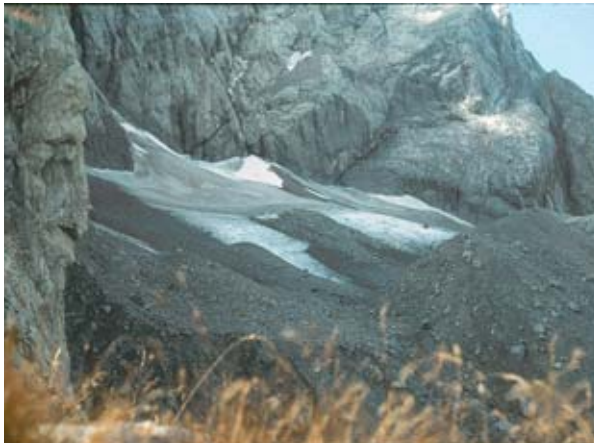
Abb. 5: Blick von Osten auf den Eiskargletscher. Links ist 1980 neben Altschnee und Firn auch noch Blankeis zu erkennen, rechts sind 2008 weite Teile des Gletschers von Schutt bedeckt.

In den letzten Jahren hat die Schuttbedeckung am Gletscher stark zugenommen. Während Anfang der 1980er Jahre nur geringe Teile des Gletschers mit Schutt bedeckt waren, tritt in den letzten Jahren nur mehr