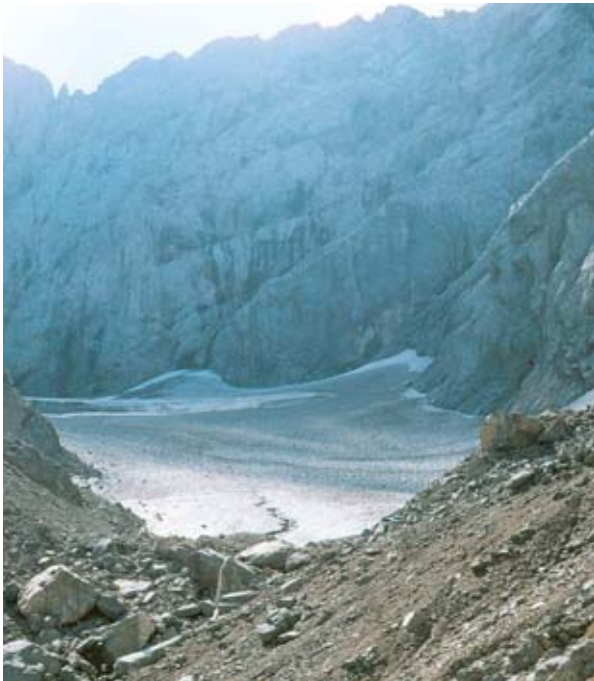
Abb. 2: Die breite Gletscherzunge im Sommer 1980 und der schmale Rest im September 2007. Seit 1978 zieht sich der Gletscher ununterbrochen zurück, wobei der Rückzug in den letzten zehn Jahren phasenweise sehr rasant vor sich ging.

Anhand der lange zurückreichenden Messreihe können die einzelnen Vorstoß- bzw. Rückzugsphasen des Eiskargletschers in den letzten 110 Jahren gut dokumentiert werden. Wie viele Alpengletscher erreichte auch das Eiskar um das Jahr 1920 nochmals einen Höchststand, wobei das Eiskar bereits um die Jahrhundertwende um einige Meter vorstieß und dann bis zum Jahr 1920 annähernd stationär blieb. In den folgenden Jahrzehnten zog sich der Eiskargletscher dem alpinen Trend entsprechend kontinuierlich zurück, nur bei der Nachmessung 1978 wurde nochmals ein Vorstoß von 7,2 m seit 1971 registriert, welcher auf die kühlen und schneereichen Jahre zwischen 1950 und 1978 zurückzuführen war. Seit 1978 zieht sich der Gletscher ununterbrochen zurück, wobei