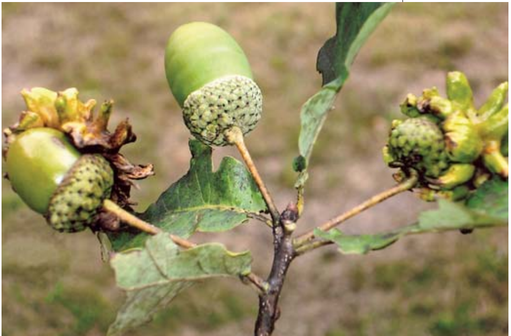
Abb. 3: Eichenknopperrn- Gallwespe ( Andricus quercuscalicis ), Lienz, Schloss Bruck, 2008. Im Sommer besitzen die Gallen eine grüne Farbe.

Die Eichenknopperrn-Gallwespe braucht zu ihrer Entwicklung die Zerr-Eiche als Zwischenwirt, dort entwickeln sich im Frühjahr die Geschlechtstiere in den männlichen Blütenständen, allerdings klein und schwer zu sehen. In allen Fällen sind die auffälligen Gallen leichter zu finden und besser bekannt als die nur 1–4 mm kleinen Gallwespen.