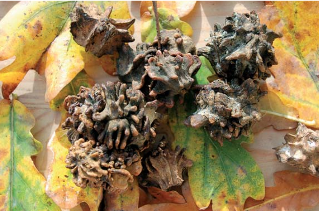
Abb. 4: Eichenknopperrn- Gallwespe ( Andricus quercuscalicis ), Keutschacher Seental, Kärnten, im Herbst sind die verholzten Gallen braun gefärbt.

Allgemein als „Gallen“ bezeichnet werden Pflanzen-Wucherungen verschiedener Art, ausgelöst durch „Speichelsekrete von Gallwespen“ und von vielen anderen Tieren (DATHE 2003: 635). Zudem kennt man weitere Gallwespen und Insekten als zusätzliche „Einwohner“ (Inquilinen), welche die „Nahrungsreserven der Gallwespen nutzen“ (DATHE 2003: 635). Aus diesen Gründen sterben viele der Parasiten ab (DATHE 2003: 635). Knopperrn heißen die „Galläpfel an grünen Eichelkelchen“ (laut Duden).