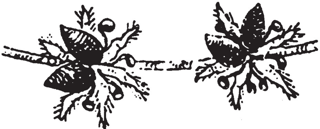
Abb. 5: Männlicher Blütenstand der Zerr-Eiche ( Quercus cerris ) mit Gallen der Geschlechtsge- neration, ausgelöst von der Knopperrn- Gallwespe (WEIDNER 1974: 501 nach Pflän- zenreiter und Weidner 1958).

Die Unterscheidung der wenigen einheimischen Eichenarten nach Behaarung und Länge der Laubblattstiele, der Cupulaform und Blattrandbildung ist gut möglich, abgesehen von Rassenbildung und möglichen Hybridisierungen (FISCHER et al. 2005). Bei den über 40 Arten weltweit (ENKE et al. 1994) und auch schon bei den Arten im Mittelmeergebiet ist die Bestimmung schon schwieriger. Die Bestimmung der Gallwespenarten ist vorwiegend den Spezialisten vorbehalten, daher ist auch die Verbreitung ungleich gut erforscht: Auf den Britischen Inseln gibt es etwa 90 Arten, davon 42 an Eichen (CHINERY 2005), in Deutschland 99 (KWAIST 2001, 2008), in Südtirol 34 (monographische Arbeit bei K. Hellrigl in Ausarbeitung), in Osttirol bisher 16 Arten sicher (KOFLER 2007, unpubliziert). Weitere Mitteilungen von Beobachtungen an den Erstautor sind erbeten und willkommen.