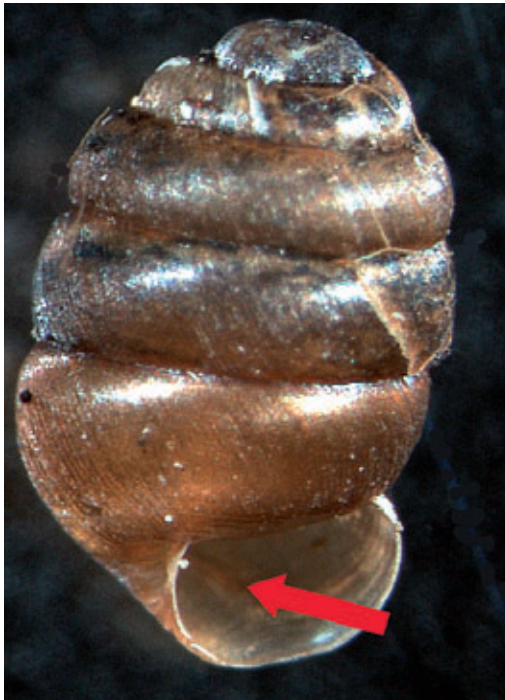
Abb. 6: Pupilla sterrii (2,8–3,5 x 1,6 mm) mit einer schwachen Palatallamelle (roter Pfeil) vom Eggerloch (colliner Felsenstandort).

Pyramidula pusilla (Vallot, 1801) Nach KLEMM (1951) zählt Pyramidula pu-