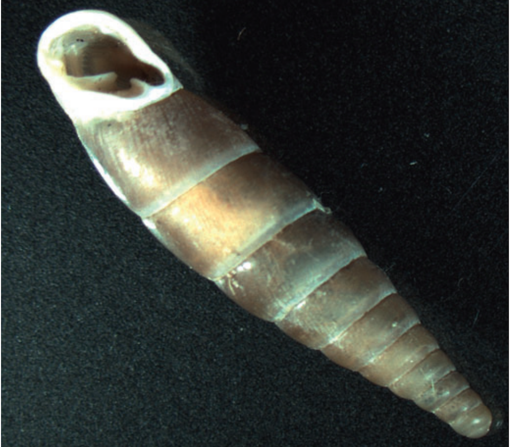
Abb. 8: Cochlodina dubiosa (12,8–6,8 x 3,4–3,7 mm); wir fanden diese Schnecke vor allem am Egger- loch, einem colli- nen Felsenstandort mit starker Sonnen- einstrahlung.