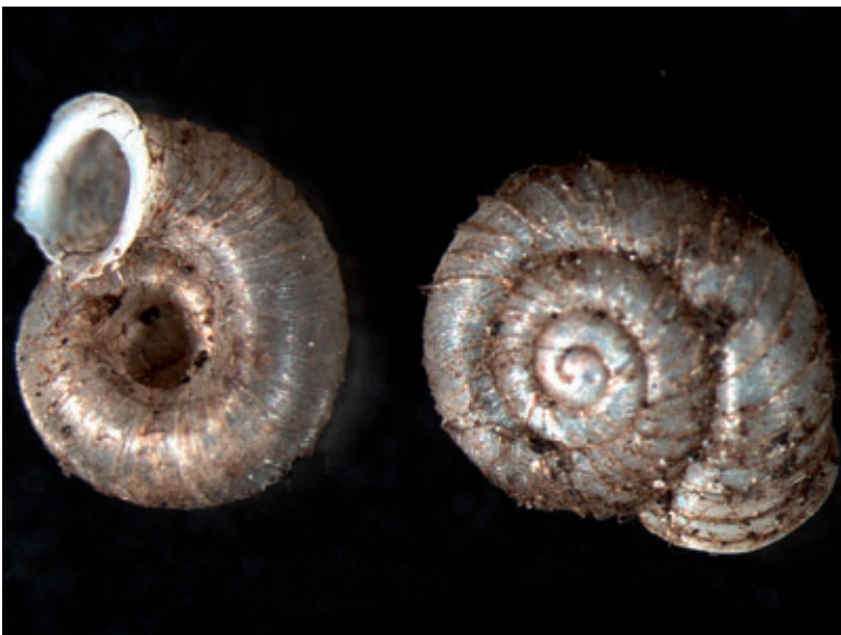
Abb. 4: Eine Schale von Vallonia costata (2,2–2,7 mm Breite), deutlich unter- scheidbar von V. pulchella durch die starke Rippung.