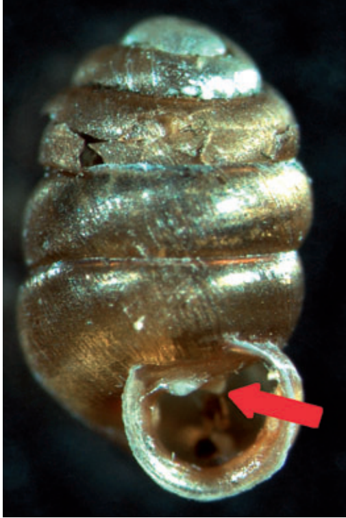
Abb. 5: Die Schale einer vierzähligen Pupilla triplicata (2,2–2,8 x 1,4 mm – der vierte Zahn ist durch den roten Pfeil gekennzeichnet) von einem collinen Felsenstandort, dem Eggerloch.

cata . Diese Art ist im Regelfall durch drei Zähne (einem Parietal- und zwei Palatallamellen) gekennzeichnet. Bei diesem Individuum ist der Parietalzahn noch einmal gespalten und erzeugt somit einen nach hinten versetzten vierten Zahn (Abb. 5).