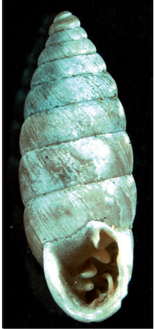
Abb. 7: Granaria illyrica (9–11,5 x 3,2–4 mm) mit typischem Habitus.

Wir fanden C. intermedium an collinen und alpinen Fels-Standorten. In beiden Fällen konnten wir lebende Exemplare nur an stark sonnenexponierten Hängen unter größeren Steinen finden. Somit würden wir diese Art im Gegensatz zu KERNEY et al. (1979) nicht als hygrophil bezeichnen.