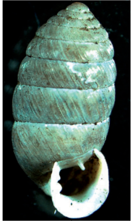
Abb. 3: Eine Schale von Orcula dolium dolium (6,7– 9 x 3–3,6 mm) vom Jägersteig (alpines Felsenhabitat).

Diese Art konnten wir in größerer Zahl am Eggerloch nachweisen. Sie besiedelt hier das Epilithion. An diesem Standort fanden wir auch eine kleine Kuriosität, eine vierzählige P. tripli-