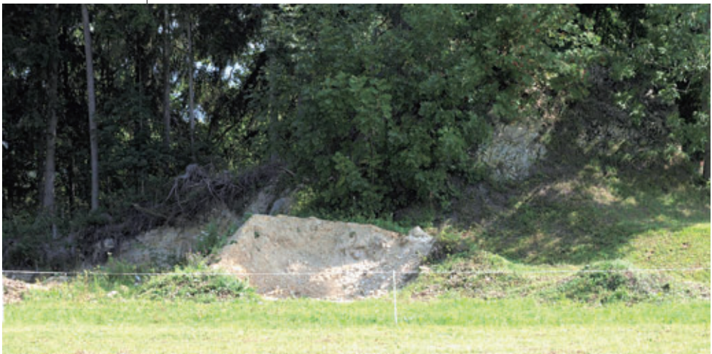
Abb. 6: „Schoberegg“: Aufschluss in tiefgründig verwittertem Pegmatit.

Berücksichtigt man die nun sowohl von archäologischer, teils auch von geologischer Seite vorliegenden Fakten, dann liegt die Schlussfolgerung nahe, dass der potenzielle Fundpunkt des Goldvorkommens der „Norischen Taurischer“ etwa 250 m nordöstlich des Gehöfts „Schaffer“ in einem kleinen Wäldchen rund um den hier anstehenden Pegmatit angenommen werden kann. Und genau hier befinden sich – allerdings bisher leider nicht einordenbare – fragliche Spuren einer früheren Durchwühlung. Eine gewisse Sicherheit für das hier dargelegte Szenario können aber erst weitere archäologische Funde gewährleisten.