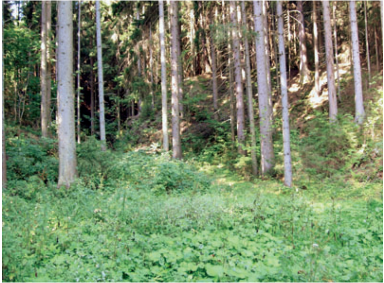
Abb. 5: Pegmatitaufschluss bei K. 1.025 m, „Schaffer“.

beim Gehöft Schaffer, wo auch noch Haldenreste aus dieser Zeit vorliegen.