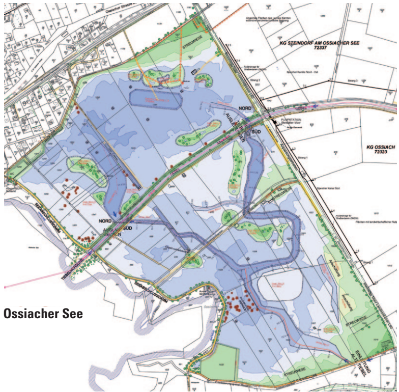
Abb. 1 a und b: Angestrebte Entwicklung im Rahmen der Bleistätter Moor-Flutung. (a) Ausführungsplan (Grafik: P. Krameter, Wasserverband Ossiacher See) und (b) Visualisierung (Ingenieurbüro Bolt). Alle in (b) östlich (im Bild links) des Damms (durch die helle Linie des Schotterwegs erkennbar) gelegene Gebiete sind heute noch trocken: Stand Sommer 2016!

gesehen, nach wie vor intensive Landwirtschaft betrieben wird, wurde im Westen von der Kärntner Landesregierung per 23. Dezember 2010 das Europaschutzgebiet (ESG) Tiebelmündung (LGBl. Nr. 94/2010 idF 28/2012) verordnet. Dieses umfasst 62,5 ha, welche durch einen Damm grob in zwei Teilareale, einen westlich gelegenen Seeteil (mit Offenwasser, Binsen, Schilf etc.) und einen östlich gelegenen Offenlandteil (mit Brachflächen, Wiesen, Weiden und Äckern), getrennt sind. Kleinere Schwarz-Erlenbestände kommen beiderseits des Damms vor. Alle diese Flächen umfasst mit 289 ha das wesentlich größere Landschaftsschutzgebiet Ossiacher See-Ost (vgl. MOHL et al. 2008).