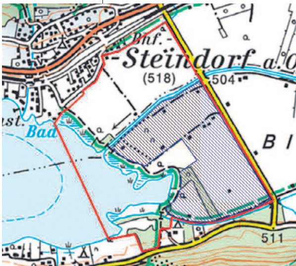
Abb. 2: Der Untersuchungs- bereich bei Steindorf (rote Linie) beinhaltet das Europaschutz- gebiet Tiebelmündung und angren- zende Flächen (blaue Schraffie- rung). Das geplante Flutungsareal (74,9 ha) befindet sich im östlichen, mit einem Damm (strichlierte Linie) vom See getrennten Bereich des Untersuchungs- gebietes.

Wie bereits in der Einleitung erwähnt, wurden einige Zielarten ausgewählt, um die Lebensraumveränderungen im Bereich der Tiebelmündung und teilweise im Bleistätter Moor über die Jahre illustrieren zu können. Im Rahmen des Flutungsprojekts ist ein