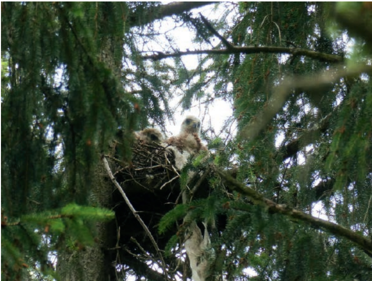
Abb. 2: Die beiden Jungvögel des Brutpaares I.

reiche Bewirtschaftung in Form von Weideflächen, verschiedenen Wiesentypen mit unterschiedlichen Mähzeiten und zahlreichen extensiv genutzten Grünlandflächen in Hanglage bietet eine gute Nahrungsbasis für Greifvögel. In unmittelbarer Nähe eines Horstes brüteten 2020 auch Schwarzmilane. Der Brutplatz des zuerst entdeckten Brutpaares (Brutpaar I) liegt am Randbereich einer Kleinsiedlung auf einer Seehöhe von ca. 600 m. Das Brutgebiet des zweiten Brutpaares befindet sich am nördlichen Rand des Lurnfeldes und besteht aus einer ähnlich vielfältigen Landschaft wie die des ersten Brutpaares. Der Standort des zweiten Horstes liegt deutlich abseits vom Siedlungsgebiet in ca. 700 m Seehöhe, in der Nähe befindet sich ein Gehöft.