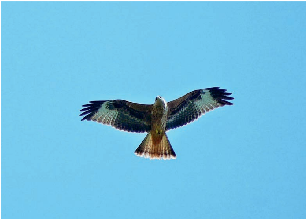
Abb. 5: Die Rotmilane hielten sich noch bis Mitte Dezember im Gebiet auf.