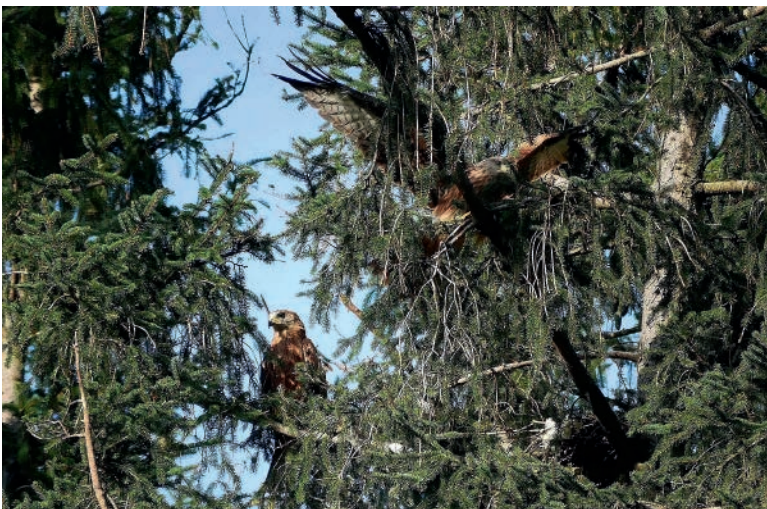
Abb. 3: Beide Jungmilane haben ihre ersten Flugversuche absolviert, kehren jedoch noch zum Horst zurück.