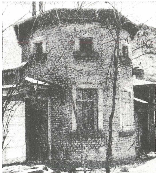
Abbildung 3. Turm der ehemaligen Sternwarte im Nymphenpark, kurz vor dem Abbruch (BVZ v. 28. 1. 1958).

Die Sache wurde danach nicht weiter verfolgt und ad acta gelegt. Dagegen wurde ein Ausbau des Friedrichs-