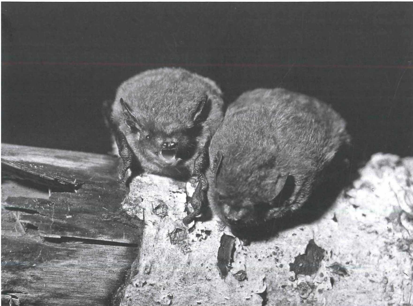
Abbildung 1. Zwei Mückenfledermäuse ( Pipistrellus pygmaeus ), die kurzzeitig in Pflege gehalten werden mussten. Das linke Tier wurde zur Wiedererkennung an der Daumenkralle mit Nagellack farbmarkiert.

Das ca. 16 km 2 große Untersuchungsgebiet umfasst etwa die Hälfte des "Heidelberger Stadtwaldes" und gliedert sich in zwei Teilbereiche nördlich und südlich des tief eingeschnittenen Neckartals. Geomorphologisch zählt das Gebiet zu den Randhängen des Sandsteinodenwaldes. Von den dort in 39 Gruppen ausgebrachten 227 Kunsthöhlen werden mindestens 18 Gruppen mit zusammen 124 Kästen von den hier untersuchten Arten benutzt. Die Jagdräume der zugehörigen Tiere konnten nicht näher abgegrenzt werden; sie dürften sich jedoch größtenteils auf das Untersuchungsgebiet beschränken. Die Höhenlage ist collin bis submontan (höchste Fundstellen ca. 430 m üNN). In den heterogenen, heute nachhaltig bewirtschafteten Waldbeständen dominiert die Rotbuche ( Fagus sylvatica ). Vielerorts sind standortfremde Baumarten eingebracht. Sechs kleinere Forsteiche sind integriert und die Flussauen von Neckar und Elsenz schließen in teils geringer Distanz (1,5-5 km) an das Gebiet an. Die Siedlungsränder mehrerer Teilorte und der Stadt Heidelberg selbst sind an zwei Stellen unter 1 km von den nächstgelegenen Kastengruppen entfernt.