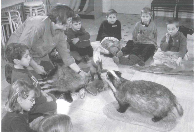
Abbildung 3. „Fast wie lebendige Tiere“ dachten wohl die Kinder, als ihnen von Mitarbeitern der Museumspädagogik präparierte Säugetiere gezeigt wurden.