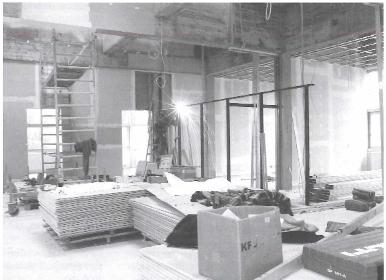
Abbildung 6. Bauarbeiten am Pavillon im Nymphengarten. In das Gebäude werden voraussichtlich in der ersten Jahreshälfte 2004 die Wissenschaftlichen Abteilungen Entomologie, Geologie und Zoologie einziehen.

- Mit der Beschaffung von Geräten und Ausrüstungsgegenständen konnte noch im Herbst 2002 ein neues,