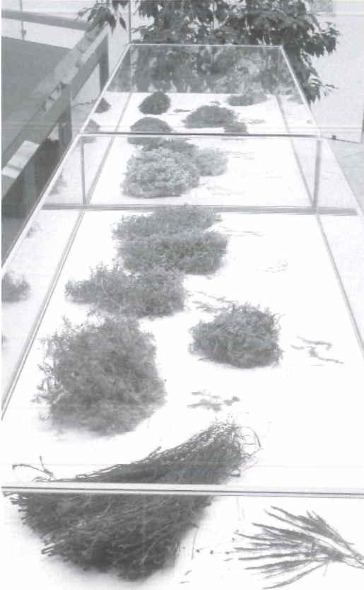
Abbildung 4. In der Ausstellung „Natur (v)ermittelt, die Grundlagenwerke zum Naturschutz in Baden-Württemberg“ wurden auch Belege aus den Sammlungen gezeigt.

die Betreuung der zahlreichen Mitarbeiter im Rahmen der fortlaufenden Datenerhebung zur Fauna Baden-Württembergs (Landesdatenbank Schmetterlinge). Mitarbeiter der Zoologischen Abteilung haben auch in diesem Jahr häufig Auskünfte zu Aquaristik und Terraristik, zoologischen Funden und Beobachtungen u.ä. an Bürger und Institutionen erteilt. Die Abteilung leistete gegenüber Behörden (Polizei, Veterinärämter, Zoll) vielfache Amtshilfe (Identifikation, Einfangen und Übernahme verschiedener Tiere etc.). Die im Haus angesiedelte Koordinationsstelle für Fledermausschutz Nordbaden übernahm die Beratung der Bevölkerung und des amtlichen Naturschutzes in Fragen des Fledermausschutzes.