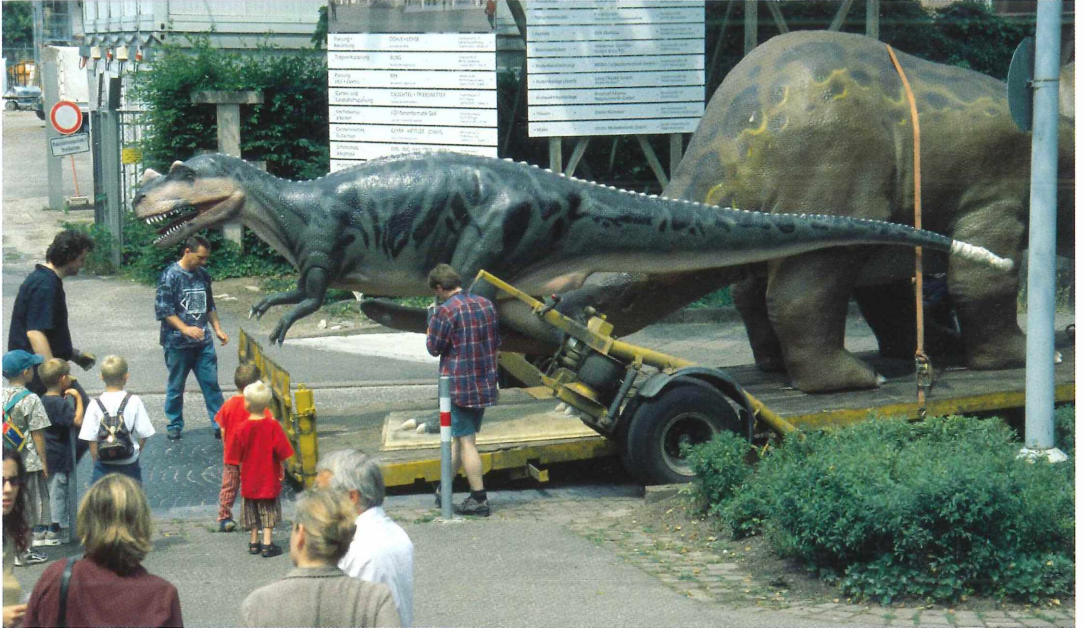
Tafel 1. a) Schon vor Ausstellungsbeginn eine Attraktion: Für die Geopark-Ausstellung wurden große Sauriermodelle durch die Stadt transportiert.