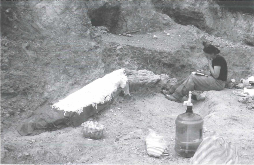
Abbildung 5. Forschung im Feld: Die Paläontologen um Dr. E. FREY legen in Mexiko Teile des Skeletts eines riesigen Pliosauriers frei. Das fossilisierte Tier wurde von der Presse „Monster aus Aramberri“ getauft.

sammlung erhalten. Der Flugsaurier aus Muzquiz wurde aus der Wand eines Büros herauspräpariert und gelangte zur Bearbeitung ins Museum. Auf dieser Reise wurden auch die Überreste eines weiteren Pliosauriers aus der Gegend um Aramberri nach Karlsruhe geschafft. Die Reise wurde von der DFG und der VW-Stiftung finanziert.