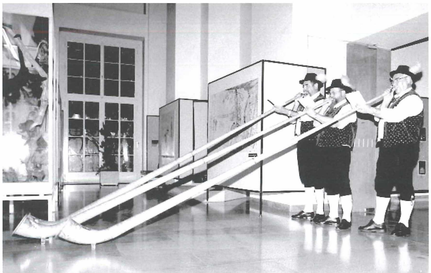
Abbildung 1. Alphornbläser sorgten für gute Stimmung bei der Ausstellung „Im Reich der Meerengel“.

Mit der Einführung des Vierteljahresprogramms im April 2002 wurden zusätzliche kostenlose Angebote für Erwachsene wie Seniorenführung, Rätsel der Natur und die Vorlesestunde für Kinder ins Programm aufgenommen. Insgesamt 27 dieser anmeldefreien