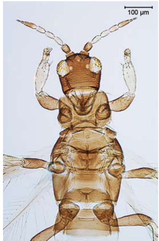
Abbildung 1. Iridothrips mariae ♀ (D-14/4). Kopf und Thoraxbereich, dorsal. – Alle Abbildungen: M. R. ULITZKA.

Monophag unter Blattscheiden von Typha angustifolia [Schmalblättriger Rohrkolben] und T. latifolia [Breitblättriger Rohrkolben], zeitweise unter der Wasseroberfläche. Ernährung: Phytophag. Verbreitung: Östliches Mitteleuropa (Polen,