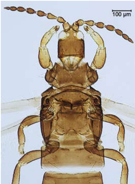
Abbildung 7. Tylothrips osborni ♀ f.m. (D-33/1). Kopf und Thoraxbereich, dorsal.

Detricoler Laubstreubewohner. Ernährung nach MOUND (1976) mycophag an Pilzhyphen und deren Zerfallsprodukten. Verbreitung: Östliche USA, mehrfach verschleppt (siehe Bemerkung). Fundort: Ortenberg, Waldrand beim Wanderparkplatz: 1♀f.m. (D-33) am 12.07.2012 an abgestorbenen, aufgeschichteten Weinstöcken ( Vitis vinifera ), die zum Teil mit Urtica dioica [Große Brennnessel] durchwuchert waren. Der Fundort liegt in unmittelbarer Nähe eines Baches und ist recht feucht.