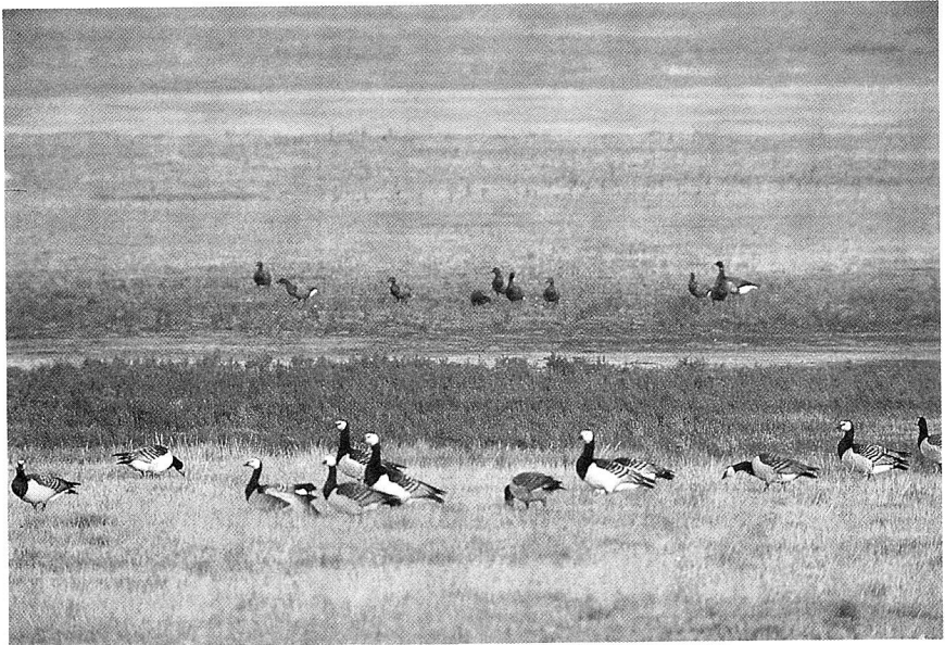
Abb. 2: Anscheinend gemeinsam weidende Ringel- und Weißwangengänse beanspruchen unterschiedliche Pflanzenbestände, nämlich Ringelgänse die dunkler gefärbten Quellerbestände nahe der Prielsohle und Weißwangengänse die heller gefärbten Grasflächen auf stärker ausgesüßten Böden an den höhergelegenen Prielhängen. Helmsanderkoog, 29. Okt. 1985.

Die im Herbst 1985 bekanntgewordenen Weideplätze sind in Abb. 1. a dargestellt. Die Weideflächen sind charakterisiert durch das dominante Vorkommen von Queller. Anscheinend mit Weißwangengänsen gemeinsam weidende Ringelgänse ernährten sich bei näherer Betrachtung jedoch meist von anderen Pflanzenarten als diese. Das wurde besonders dort augenfällig, wo an den tiefsten Stellen seichter Prielrinnen der herbstrote bis trockene Queller einen auffälligen farblichen Kontrast zu der grünen Färbung der Vegetation an den nur wenige Zentimeter höher gelegenen Prielhängen bot. Während die Weißwangengänse fast nur die grüne Vegetation an den Prielhängen beanspruchten, weideten die Ringelgänse weit überwiegend in den rotbraunen bis trockenen Quellerfluren (Abb. 2). Das scheint sich mit der meist braunen Färbung der Kotstücke zu decken (Tab. 4).