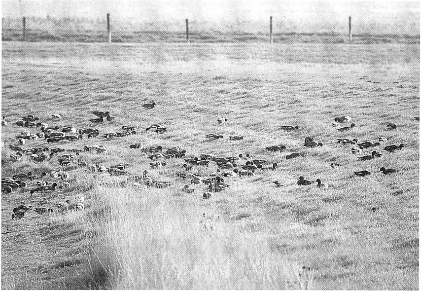
Abb. 3: Pfeifenten beweiden einen von Süßgräsern bewachsenen Speicherdeich. Helmsanderkoog, 21. Okt. 1985

sächlich von Tangen und Seegras, aber auch von Gräsern nasser Wiesen ernähren (VOOUS 1962, OWEN 1980). Solche Unterschiede ergeben sich auch entlang der Westküste von Schleswig-Holstein. Hier kommt es im Herbst und Winter zu Ballungen des Ringelgansvorkommens in der Seegraszone des nordfriesischen Wattenmeeres; mit dem schwindenden Angebot gehen die Vögel aber zur Beweidung der Salzwiesen über (BUSCHE 1980). In den letzten Jahren wurden auch Ringelgänse auf Wintersaaten beobachtet (BERNDT & BUSCHE 1985, P. PROKOSCH mdl.). Weißwangengänse beweideten an der schleswig-holsteinischen Westküste vornehmlich die Salzwiese, aber auch Weideland und andere Flächen (wie Getreidefelder) und das Pfeifentenvorkommen zeigt Übereinstimmungen mit dem der Ringelgans, „was wohl auf die Ernährung (mit Zostera ) im Watt sowie im grasigen Vorland (bis zu den Deichen) zurückzuführen ist“ (BUSCHE 1980). Im Helmsanderkoog war die Pfeifente bereits im Winter 1974/75, als die Flächen des Südtiles noch weitgehend mit Queller bewachsen waren, eine der häufigsten Arten. Ihre Nahrungssuche fand damals aber nicht im Koog, sondern bevorzugt auf benachbarten Schlickwatten statt (GLOE 1984 a), wo übrigens kein Seegras und nur selten Grünalgen vorkommen.