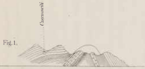
Zeichenerklärung für Fig. 1.

Oberer Kalk Trüffler, Mucigno und Serpentin Kalkeinlagerungen