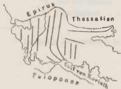
Die geraden Striche geben die Richtung der Bergketten an.

Es ist das eine sehr eigenthümliche Combination von senkrecht gegen einander streichenden Ketten, die ich durch den beistehenden Holzschnitt anschaulich zu machen gesucht habe, und auf welche ich später noch zurückkommen werde.