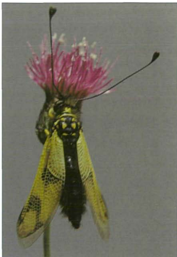
Abb. 1: Weibchen von L. macaronius auf Ungarischer Distel Cirsium pannonicum , Brunngaben bei Laussa, 22. Juni 2003.

re Waldlichtungen mit steppenartigem Charakter. In den Ennstaler Voralpen sind es fast ausschließlich flachgründige Kalkmagerwiesen über Dolomitgestein. Grünlandstandorte über Flyschgestein sind überwiegend frischer und weniger stark geneigt und können daher intensiver genutzt werden. L. macaronius wird zoogeographisch von ASPÖCK et. al. (2001) als expansives polyzentrisches pontomediterranes Faunenelement bezeichnet.