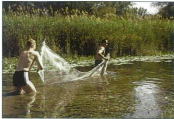
Abb. 4: Zerkarien-Dermatitis-Risiko bei Tätigkeiten in naturnahen Gewässern.

Bei Sektionen können allerdings junge Sporozysten leicht übersehen werden. Für die epidemiologische Einschätzung und für ein eventuelles „Frühwarnsystem“ wäre es aber wichtig, früher Stadien zu erfassen und möglichst realistische Prävalenzen zu erheben.