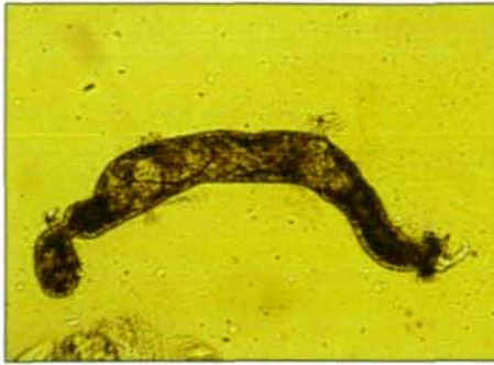
Abb. 1: Sporosyste von Trichobilharzia szidati aus Lymnaea stagnalis , Wienerwald, Niederösterreich.