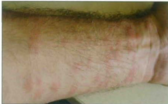
Abb. 5: Zerkariendermatitis 24 Stunden nach dem Eindringen.

Als Nachweis der Zerkarien wurde auch versucht, die Schwimmlarven aus dem Wasser mittels Planktonnetzen oder Filtern anzureichern. Das erscheint – aufgrund der Zartheit der Tiere – mit methodischen Schwierigkeiten verbunden.