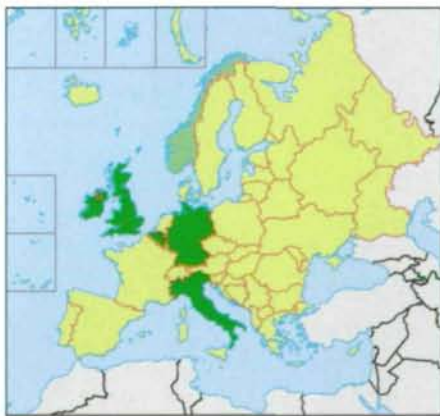
Abb. 5: Verbreitungskarte von Pectinatella magnifica (LEIDY 1851).