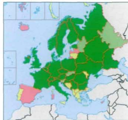
Abb. 1: Verbreitungskarte von Plumatella fruticosa ALLMAN 1844. © Fauna Europaea.

Seit kurzem ist Plumatella geimermassardi auch aus Frankreich bekannt, und zwar anhand von Material, das im August 2001 und 2002 von Jean-Loup d'Hondt (Muséum National d'Histoire Naturelle, Paris) in einem