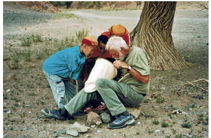
Abb. 8: 2005 - ... bei interessierten Klosterschülern in der Gobi.