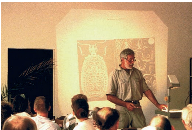
Abb. 4: 1995 – Heteropterologentagung am „Hölzernen See“ nahe Berlin.

Abendessen und fröhliche Familienurlaube mit unseren beiden Kindern.