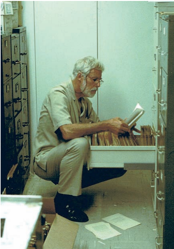
Abb. 7: 1998 – Literatursuche im Smithsonian, Washington.