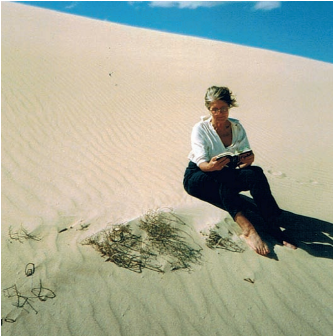
Abb. 5: 1996 – die beste aller Ehefrauen liest und wartet und wartet...