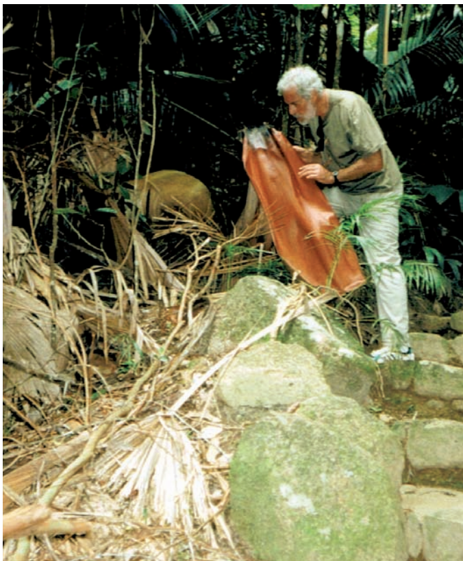
Abb. 2: 1994 – Seychellen – die Tropen locken.