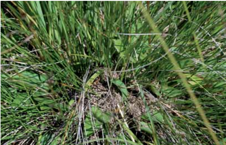
Abb. 5: Formica picea – Nest.