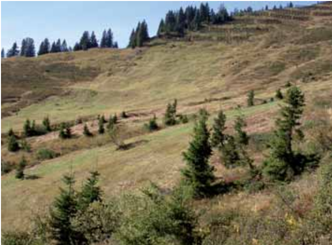
Abb. 13: Formica pressilabris – Habitat (Falvkopf, Vorarlberg).