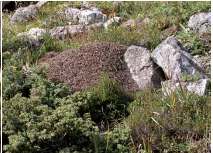
Abb. 10: Formica exsecta – Nest.