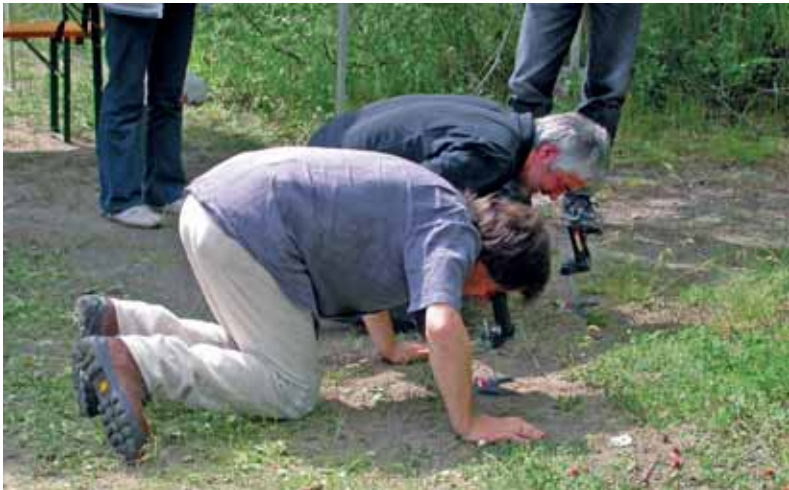
Abb. 21: Kleine Welt ganz groß – Homo sapiens beobachtet Ameisen der Art Manica rubida durch ein Feldbinokular im Rahmen einer Öffentlichkeitsveranstaltung.

(Vegetationsstruktur, Untergrundbeschaffenheit, ...) sowie zu abiotischen Faktoren wie beispielsweise der Temperatur. Die Standorttreue von Ameisennestern erlaubt die Korrelation mit in unmittelbarer Nestumgebung bzw. im Nest erhobenen Daten.