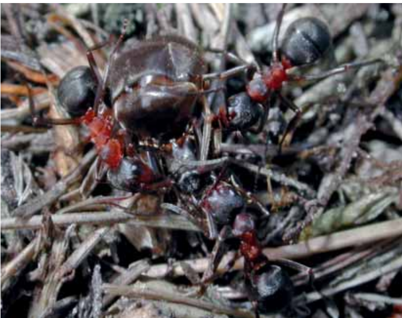
Abb. 18: Formica foreli – Arbeiterinnen überwältigen Lasius -Königin.