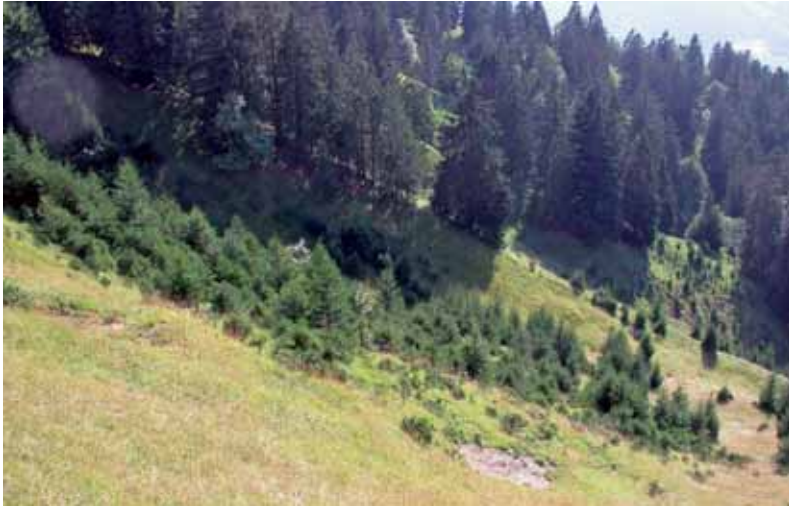
Abb. 20: Primärlebensraum für Ameisen – ein locker bewaldeter Lawenstrich in Vorarlberg (Furkla, Bludenz).