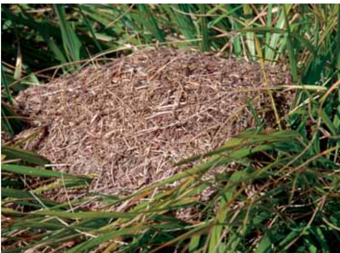
Abb. 11: Formica pressilabris – Nest.