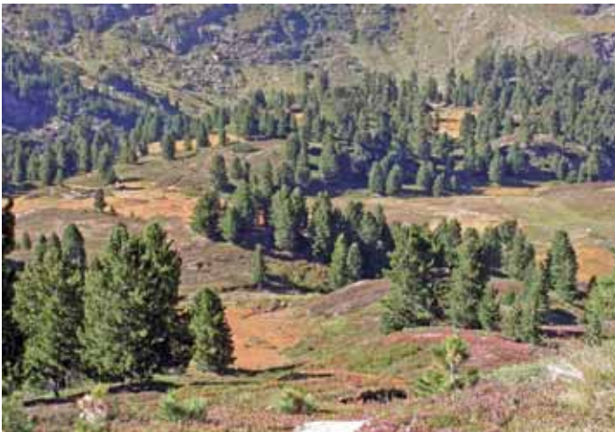
Abb. 15: Habitat von Formica suecica (Oberurgl, Tirol).