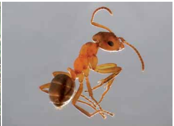
Abb. 12: Formica pressilabris , Präparat, Foto: Hannes Müller.