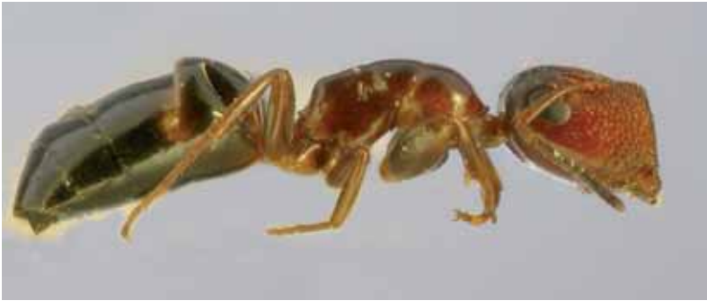
Abb. 4: Camponotus truncatus , Präparat.