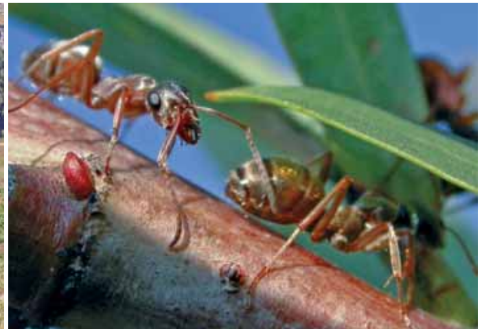
Abb. 16: Formica fuscocinerea .

GLASER 1999, SEIFERT 2000, MÜLLER mündliche Mitteilung). Das kleine Areal ist im inneren Ötztal durch Schipistenerweiterungen und Liftbau gefährdet (GLASER 2001 & unpubl.).