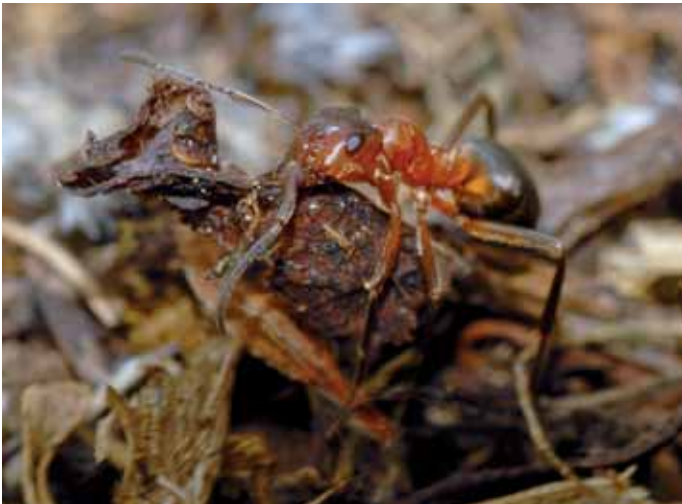
Abb. 9: Formica exsecta – Arbeiterin.