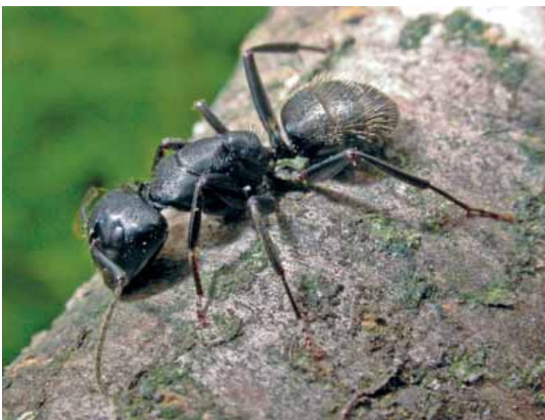
Abb. 2: Camponotus vagus .

Eine kritische Bewertung verschiedener Methoden, die zur Erfassung von Ameisen aktuell üblich sind, bildet zweifellos ein erstrebenswertes und wichtiges Ziel,