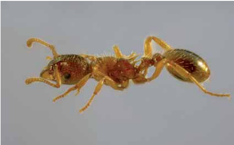
Abb. 7: Myrmica vandeli , Präparat.