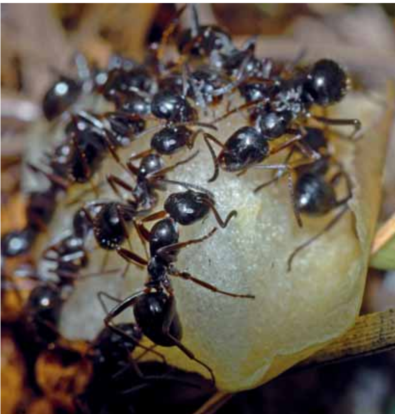
Abb. 6: Formica picea – Arbeiterinnen.

burg vor (SEIFERT 2007). F. exsecta ist die mit Abstand häufigste Coptoformica -Art in den Ostalpen und in Österreich aufgrund guter Bestände im hochmontanen bis subalpinen Bereich nur auf niedrigem Niveau gefährdet. Im Flach- und Hügelland dürfte die Art aber auch in Österreich massive Bestandeseinbußen erlebt haben (GLASER 1999). ZORMANN (2007 & schriftl. Mitt.) konnte allerdings einige historische Fundpunkte im Wienerwald aktuell bestätigen.