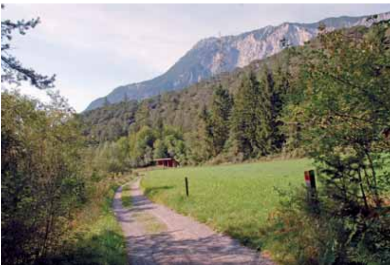
Abb. 19: Einziges ostalpines Vorkommen von Formica foreli am Öztalauseingang (Tirol), besiedelt wird nur ein schmaler Halbtrockenrasenstreifen entlang des Weges und die ruderalisierte Böschung links im Bild.

Die westalpin endemische Waldameise Formica paralugubris (Abb. 17) erreicht das westliche Österreich (GLASER 2001, 2005). Mind. 10% des Areals der Art dürfte in Österreich liegen. Die Art scheint aktuell in Westösterreich nicht gefährdet (z.B.: GLASER 2005 für Vorarlberg).