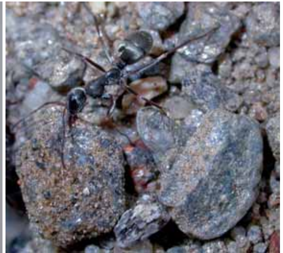
Abb. 8: Formica selysi .