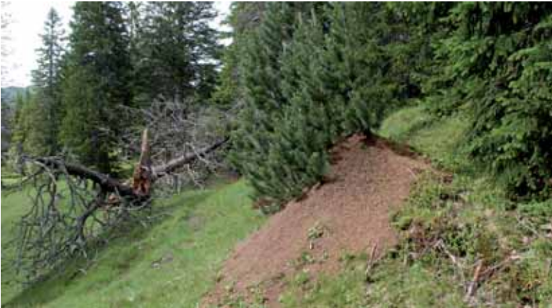
Abb. 17: Nesthügel von Formica paralugubris .