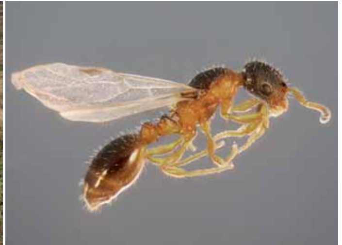
Abb. 14: Leptothorax kutteri – Königin.