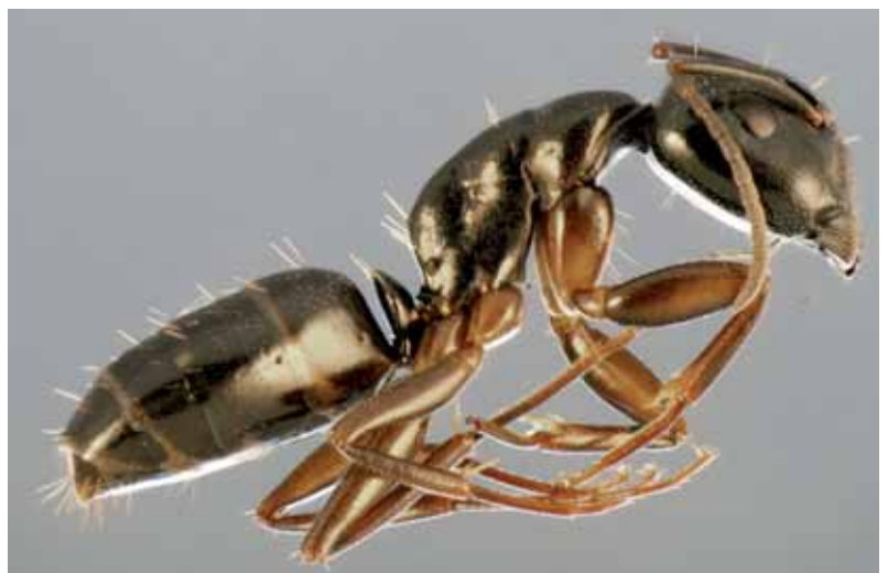
Abb. 3: Camponotus fallax , Präparat.

Die Coptoformica -Arten Formica exsecta (Abb. 9, 10) und Formica pressilabris (Abb. 11-13) sind an mageres Grasland gebunden. F. pressilabris strahlt aus den Westalpen bis nach Vorarlberg aus. Aus dem östlichen Österreich gibt es Hinweise auf ein ehemaliges, dealpines Vorkommen (Güssing, Burgenland) (GLASER & MÜLLER 2003), in Bayern kam die Art früher bei Würz-