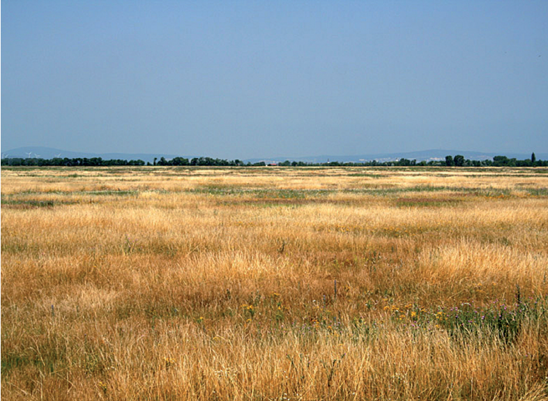
Abb. 1: Seeadler kommen in West-Ungarn nicht nur in den Feuchtgebieten, sondern auch in den ausgedehnten, niederwildreichen Agrarräumen vor. — In western Hungary, White-tailed Eagles occur not only in wetlands but also in the vast agricultural areas where small game are abundant.

Brutpaar im Jahre 1998 (Abb. 2) wurde von Jägern an die Naturschutzwache gemeldet. Die Kontakte zu den Landwirten sind besonders wichtig, bei jedem neuen Paar werden mit dem Grundeigentümer und dem Jagdberechtigten Vereinbarungen getroffen. Diese Kontakte, die wiederholt stattfinden, sind wichtig, um die Sicherheit der Brut zu gewährleisten. In geeigneten Wäldern werden auch Kunsthorste angebracht, die von Seeadler besonders gerne angenommen werden. Winterfütterung wird bei Bedarf durchgeführt. Auf einheitlichen Beschluss der ungarischen Ornithologen wurde in Ungarn die Farbberingung der Seeadler eingeführt, die in unserem Gebiet seit 2004 stattfindet.