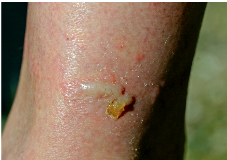
Abb. 5: Wunde 2 Tage alt, Quaddelbildung.