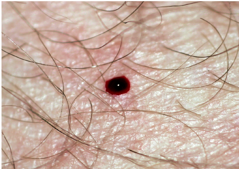
Abb. 4: Frische Wunde mit Blutstropfen.

Wiederholte Stiche der Simuliiden sind beim Menschen die Ursache für ein Krankheitssyndrom, welches als „black fly fever“ oder „Simuliose“ bezeichnet wird (FÜNFSTÜCK et al. 1989). Typische Symptome sind Kopfschmerz, fieberverursachtes Schwitzen, Schüttel-