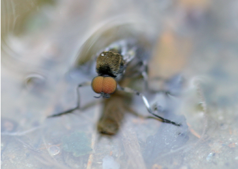
Abb. 2: Schlüpfendes Simulium noelleri Männchen.