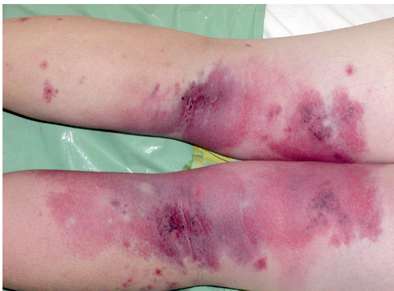
Abb. 6: Iktusreaktionen mit Knötchenbildung, Erythemen und Ödembildung am Menschen nach Simuliiden-Stichen.