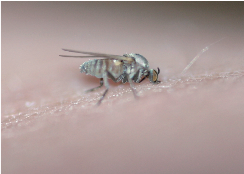
Abb. 3: Simulium sp. beim Saugakt am Menschen.

Schwärmen zu finden. Bei zahlreichen Arten dient die Schwarmbildung der Partnerfindung. Die Kopulation findet im Flug oder am Boden statt. Die Lebensdauer der Imagines beträgt selten mehr als zwei bis drei Wochen (CROSSKEY 1990), kann sich unter tropischen Bedingungen oder im Labor aber auf zwei bis drei Monate erstrecken (DALMAT 1952; DAVIES 1953).