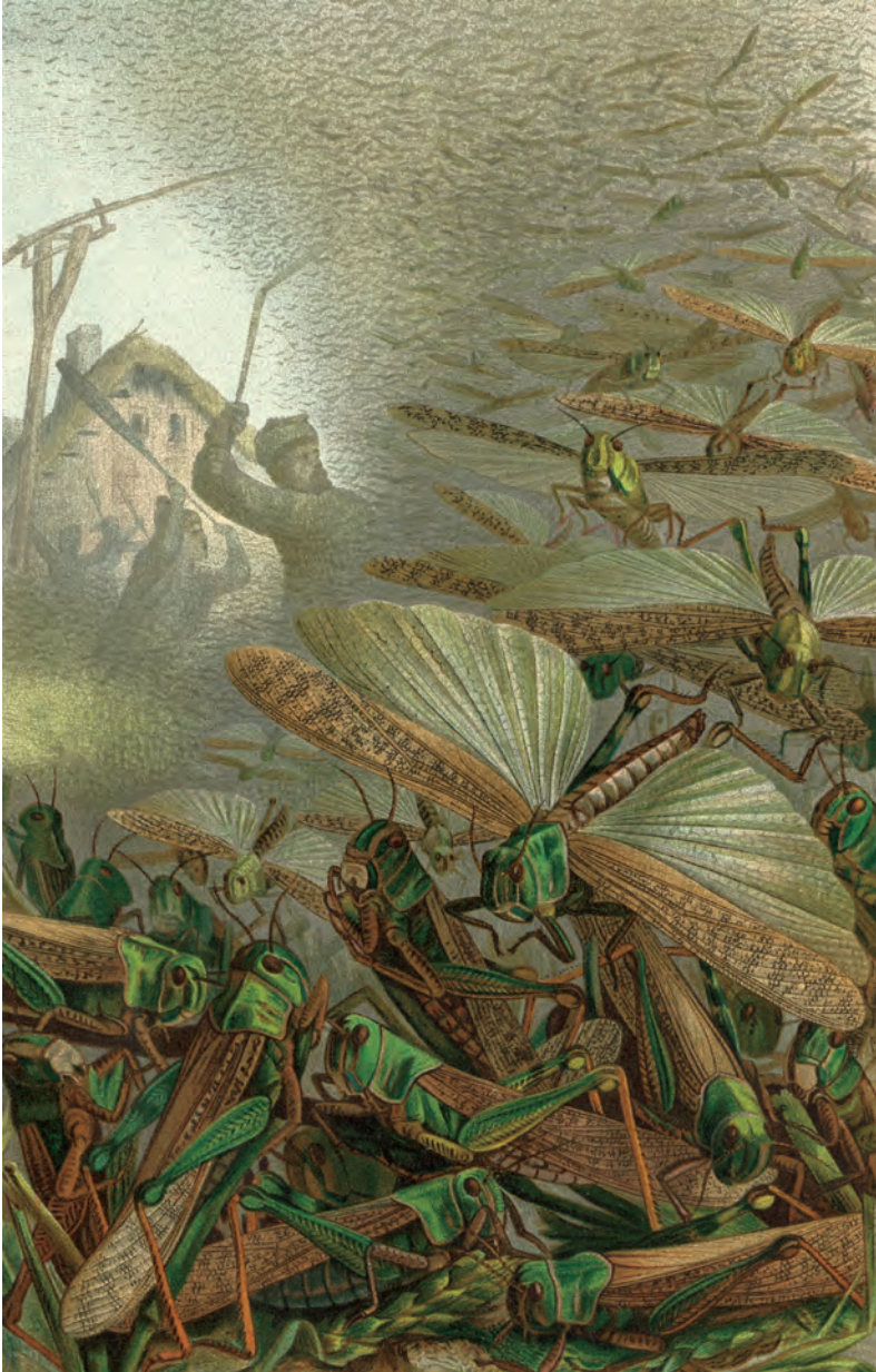
Abb. 1: Ein Schwarm der gefürchteten Wanderheuschrecke Locusta migratoria – hier in einer populären Darstellung aus Brehms Tierleben.

sich u. a. die Erstbeschreibung von Phaneroptera falcata anhand eines Tieres aus Graz (PODA 1761). Die wohl vorwiegend aus dem Raume Graz aufgebaute Sammlung des „Musei Graecensis“ ist leider verschollen (KREISSL & FRANTZ 1995). Dass man als Systematiker der Pionierzeit auch seinen Spaß haben kann, beweist die ganz in Linnéscher Tradition erstellte Taxonomie der „heimischen“ Mönchsorden durch Poda (selbst ein Jesuit) und Ignatius Born (im Jahr 1783)!