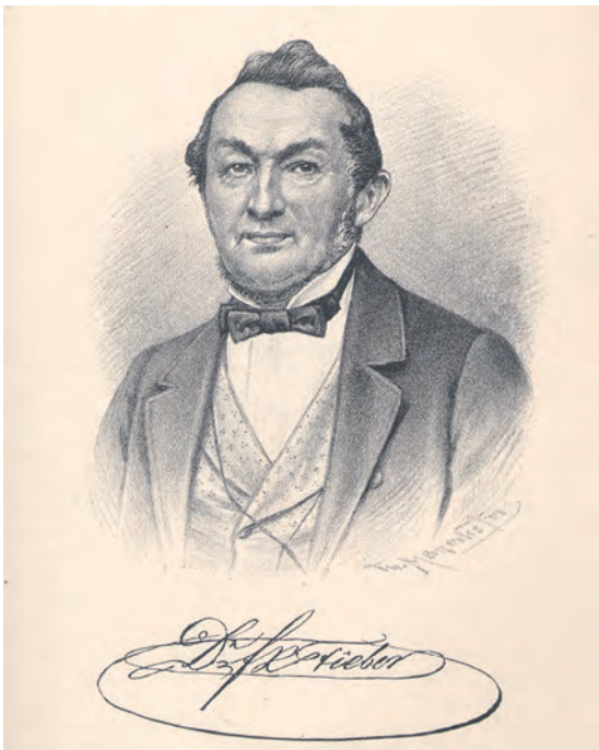
Abb. 3: Franz Xaver Fieber war einer der bedeutendsten mitteleuropäischen Entomologen des frühen 19. Jahrhunderts und beschrieb unter anderem auch die „verzwickte“, lange in Vergessenheit geratene Isophya camptoxypha .