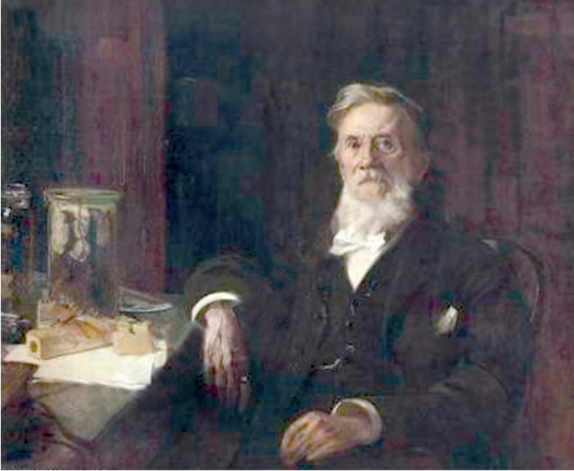
Abb. 6: Ein Gemälde des 83jährigen Carl Friedrich Brunner von Wattenwyl in klassischer Gelehrtenpose im „Naturalienkabinett“, angefertigt vom deutschen Porträtmaler Hans Temple.