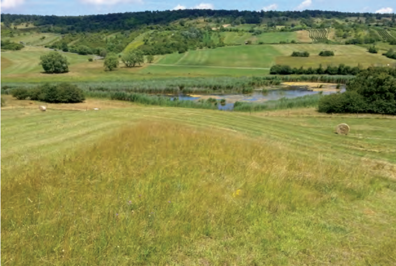
Abb. 1: Extensiv bewirtschaftete Magerwiesen sind der artenreichste Heuschreckenlebensraum in Österreich; 102 Arten konnten hier bisher gefunden werden, das Verhältnis zwischen Langfühler- und Kurzfühlerschrecken ist praktisch ausgeglichen (43 zu 44 Arten, ohne „Irrgäste“ mit weniger als drei Fundorten). Diese von Magerwiesen dominierte Landschaft im Mittelburgenland bei Marz-Rohrbach stellt einen besonders reichhaltigen Heuschreckenstandort dar; im Bildausschnitt wurden bisher über 40 Arten nachgewiesen (Blick vom Wiesenberg über die Rohrbacher Teichwiesen zum Marzer Kogel, 4.7.2014).