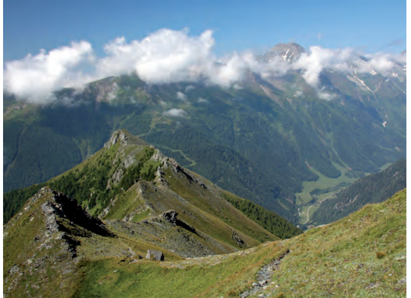
Abb. 8: Alpine „Urwiesen“ im Gipfelbereich sind Lebensraum für kältetolerante Habitatspezialisten wie Anonconotus italoaustriacus , Melanoplus frigidus und Gomphocerus sibiricus (Törlkopf im Dösenbachtal/K, 2400 m, 1.8.2009, O. Stöhr).