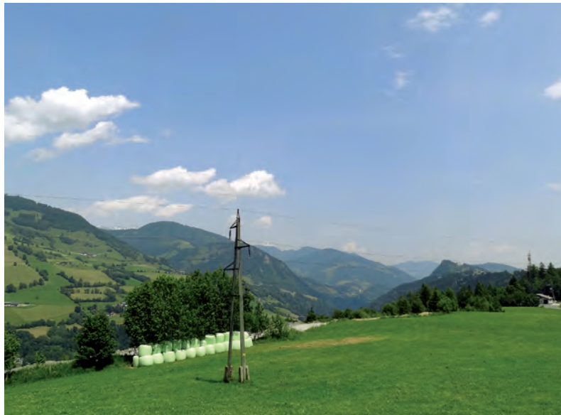
Abb. 6: Intensivwiesen mit frühen und häufigen Schnitten, hohem Nährstoffniveau und zunehmender Silagenutzung bieten nur wenigen Heuschrecken Lebensraum; typisch sind – wie hier in den tieferen Lagen des Pinzgaus – Chorthippus biguttulus und Pseudochorthippus parallelus (Taxenbach/S, 800 m, 20.6.2012,).

vielen Fundorten vertretenen Wiesen. Aber auch hier zeigt sich die große Bedeutung der extensiven Nutzungsformen auf magerem Boden („GW-E“, „GW-M“), während intensiv bestockte Weiden ebenso wie länger verbrachte Standorte deutlich geringere Artenzahlen aufweisen. Auch die fünf am stärksten auf Weideland angewiesenen Arten sind allesamt Mager- und Extensivweidenbewohner. Weideland stellt jedoch nur für Fiebers Plumpschrecke Pseudopodisma fieberi einen wesentlichen (fast 50 % der Fundorte) Anteil am Lebensraumspektrum. Für die nächstgereichte Art Stenobothrus stigmaticus betreffen Weiden bereits nur ein gutes Viertel der nachgewiesenen Fundorte. Regelmäßig auf Weiden anzutreffen sind weit verbreitete Arten, die aber ebenfalls Magerweiden bevorzugen bzw. besonders auf den bereits zu den Almen vermittelnden Weideflächen im Bergwaldgürtel („GW-A“) anzutreffen sind.