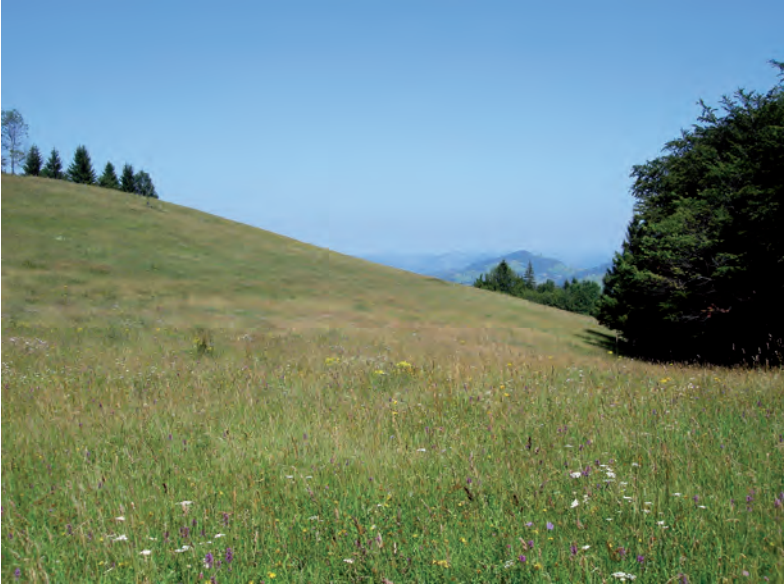
Abb. 5: Ausgedehnter Magerwiesenhang am Glaserberg bei Maria Neustift/O mit sehr häufigem Vorkommen des Warzenbeißers Decticus verrucivorus und mind. neun weiteren Arten (900 m, 12.7.2011,).

und der Feldgrille Gryllus campestris auch die beiden xerothermophilen Grashüpfer Chorthippus brunneus und Ch. biguttulus in diesem Lebensraum anzutreffen, wobei letztere vor allem die Getreidestoppelfelder im Hochsommer sowie Feldfutterflächen mit Luzerne Medicago sativa (Habitat „F-B“) bevorzugen. Die mittleren Artenzahlen pro Ackerfundort liegen bei lediglich 1,2 bis 1,8 Arten, nur der letztgenannte Typ „F-B“ beherbergt im Schnitt 2,5 Arten pro Fundort. Auch der Anteil an „Irrgästen“ ist bei einer doch erklecklichen Gesamtartenzahl von 75 Arten mit 36 % sehr hoch.