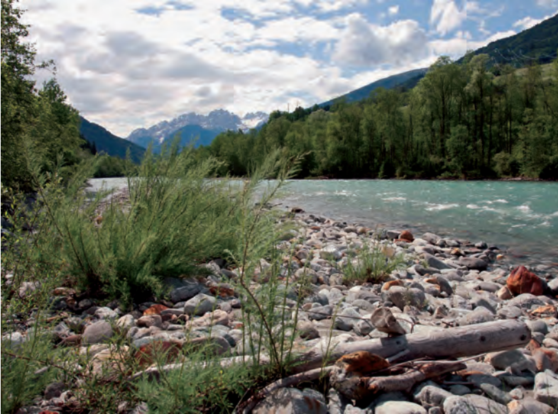
Abb. 14: Naturnahe Uferzonen an Fließgewässern sind in Österreich fast nur stellenweise im Alpenraum von der Regulierung und Verbauung verschont geblieben und beherbergen eine exquisite Heuschreckenfauna, wie hier an der Isel mit Tetrix tuerki, zusammen mit der vom Aussterben bedrohten Deutschen Tamariske Myricaria germanica (Isel bei Oberlienz/T, 700 m, 29.5.2014,).

nachgewiesen wurde. Die am regelmäßigsten anzutreffende Uferart ist nun auch eine Langfühlerschrecke – die Sumpfgrippe Pteronemobius heydenii .