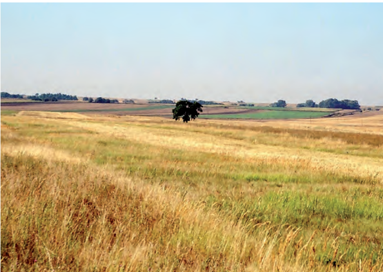
Abb. 12: Ausgedehnte Brachelandschaften auf Magerstandorten in der intensiven Getreidebauregion des ostösterreichischen Pannonikums beherbergen bedeutende Vorkommen von primär auf Trockenrasen lebenden Arten wie Tessellana veyseli, Bicolorana bicolor oder Calliptamus italicus (Bernhardsthaler Ebene/N, 19.8.2004,).

fer Chorthippus apricarius auf Trockensäumen. Einen Sonderfall stellen junge, lückige Schlagflächen dar, die den Rohbodenstandorten nahe stehen und einen typischen Lebensraum für die Gemeine Dornschröcke Tetrix undulata darstellen. Aufgrund der sehr unterschiedlichen Ausprägung der verschiedenen krautigen Lebensräume sind die Prozentwerte der stetigsten Arten vergleichsweise gering. Es dominieren hier verbreitete Arten mit Hang zu den tendenziell mesophileren Ruderal- und Hochstaudenfluren, von denen keine besonders hohe Anteile ihrer Vorkommen in diesen Lebensräumen aufweisen.