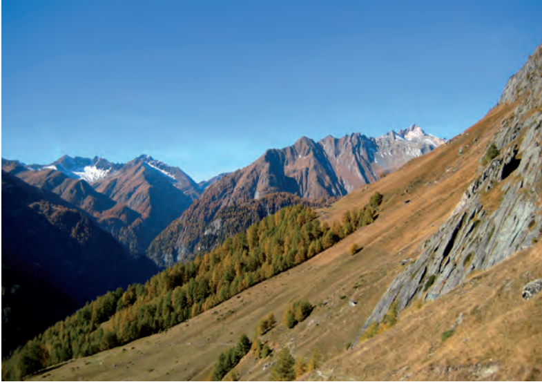
Abb. 7: Bergmähder über der Waldgrenze vermitteln zwischen den Mähwiesen und dem alpinen Grasland; sie gehören zu den artenreichsten Standorten des Alpenraums und sind von menschlicher Nutzung abhängig; in Klimagunstlagen wie hier in Osttirol leben z. B. Arcyptera fusca und Stauroderus scalaris (Dorfermähder/T, 1800 m, 7.10.2007,).