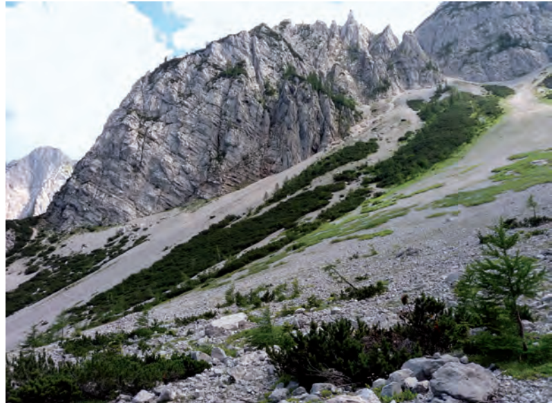
Abb. 16: Sonnendurchflutete Schuttkegel im Alpenraum bieten xerophilen Heuschrecken einen spektakulären Lebensraum; hier ist z. B. Antaxius difformis mit Chorthippus brunneus zu finden (Loibler Baba/K, 1350 m, 29.7.2016,).

allem im Alpenraum verbreitet sind, wird der überwiegende Teil dieses Lebensraumes heute vom Menschen geschaffen und „roh“ gestaltet, wie in Steinbrüchen und anderen Materialentnahmestellen, entlang von Wegrändern oder auf Lagerplätzen. Einen Sonderstandort bilden dabei vegetationsfreie Gleiskörper der Eisenbahn, die eine bemerkenswerte Grillenfauna mit Steppenrille Melanogryllus desertus und Südlicher Grille Eumodicogryllus bordigalensis beherbergen können.