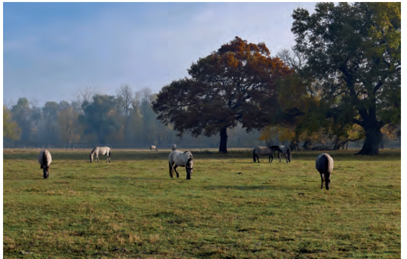
Abb. 9: Vor allem extensive Weideflächen können eine artenreiche Heuschreckengemeinschaft beherbergen; in diesem abwechslungsreichen Weideareal in den Marchauen konnten im Jahr 2016 insgesamt 32 Heuschreckenarten nachgewiesen werden (Marchegg/N, 140 m, 28.10.2016,).