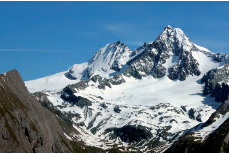
Abb. 2: Die Südseite des Großglockners in den Hohen Tauern (3798 m) – eine Landschaft ohne Heuschrecken; aus Österreich sind aktuell keine Heuschreckenfunde über 2775 m Seehöhe bekannt (23.6.2010,).

schrecken besonders spannend, was die nachfolgende Übersicht zeigen wird.