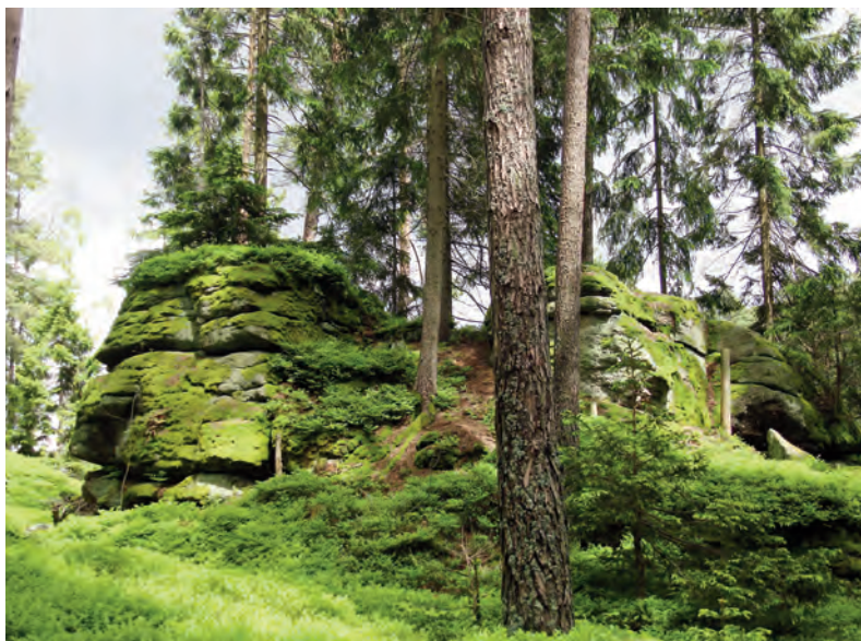
Abb. 3: Nadel- und Mischwälder des Nördlichen Granit- und Gneishochlands sind Lebensraum der einzigen reinen „Waldschrecke“ Österreichs, der Nadelholz-Säbelschrecke Barbitistes constrictus (1.6.2013, 700 m, Rappottenstein, L. Forsthuber).

cogryllus bordigalensis – in Österreich in Feldkulturen. Die deutschen Namen dieser drei „Ackerschrecken“ deuten darauf hin, dass Anpassungen an offen-trockene Steppenlandschaften beim Überleben im Ackerland hilfreich sind. Eine Eiablage in den Boden ist jedenfalls aufgrund der vollständigen Entfernung des oberirdischen Aufwuchses hier obligatorisch, außer die Feldlandschaft ist kleinteilig und durch Landschaftselemente (meist aus den „Biotoptypen“ der strauchigen und krautigen Lebensräume) als Rückzugstreifen gegliedert. Am häufigsten sind neben den Heupferden