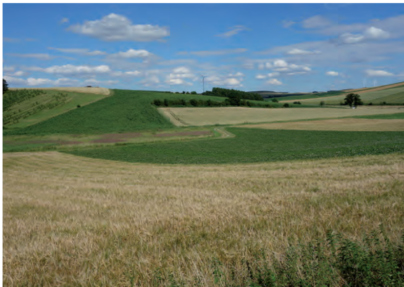
Abb. 4: Ausgedehnte reine Ackerlandschaften sind trotz der massiven menschlichen Bewirtschaftung nicht immer heuschreckenleer – in dieser Feldflur tritt neben der gefährdeten Tettigonia caudata am Oberhang auch Eumodicogryllus bordigalensis in den vernästen Unterhängen auf (Maisbirbaum/N, 230 m, 3.7.2016, T. Zuna-Kratky).

cogryllus bordigalensis – in Österreich in Feldkulturen. Die deutschen Namen dieser drei „Ackerschrecken“ deuten darauf hin, dass Anpassungen an offen-trockene Steppenlandschaften beim Überleben im Ackerland hilfreich sind. Eine Eiablage in den Boden ist jedenfalls aufgrund der vollständigen Entfernung des oberirdischen Aufwuchses hier obligatorisch, außer die Feldlandschaft ist kleinteilig und durch Landschaftselemente (meist aus den „Biotoptypen“ der strauchigen und krautigen Lebensräume) als Rückzugstreifen gegliedert. Am häufigsten sind neben den Heupferden