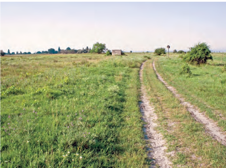
Abb. 15: Unter den artenreichen Trockenstandorten zeichnen sich manche naturnahe, extensiv bewirtschaftete Trockenrasen in bester Klimagunstlage durch eine spektakuläre Artengarnitur aus wie hier am Ostufer des Neusiedler Sees mit Gampsocleis glabra , Platycleis affinis , Montana montana , Omocestus petraeus und Stenobothrus nigromaculatus (Seedamm bei Illmitz/B, 115 m, 6.7.2006).

Der sonnendurchglühte Trockenrasen stellt den Inbegriff eines attraktiven Lebensraums für Heuschrecken dar und es verwundert einen nicht, wenn mit 15 verschiedenen Arten, die zumindest die Hälfte ihrer Fund-