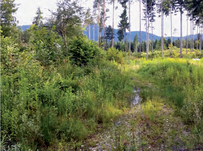
Abb. 11: Die von heimischen Arten geprägten Hochstaudenfluren des illyrisch-südpalpinen Bereichs sind Lebensraum für eine spezialisierte Gemeinschaft mit z. B. Leptophyes boscii oder Miramella irena (Arnoldstein/K, 560 m, 30.7.2014,).

fer Chorthippus apricarius auf Trockensäumen. Einen Sonderfall stellen junge, lückige Schlagflächen dar, die den Rohbodenstandorten nahe stehen und einen typischen Lebensraum für die Gemeine Dornschröcke Tetrix undulata darstellen. Aufgrund der sehr unterschiedlichen Ausprägung der verschiedenen krautigen Lebensräume sind die Prozentwerte der stetigsten Arten vergleichsweise gering. Es dominieren hier verbreitete Arten mit Hang zu den tendenziell mesophileren Ruderal- und Hochstaudenfluren, von denen keine besonders hohe Anteile ihrer Vorkommen in diesen Lebensräumen aufweisen.