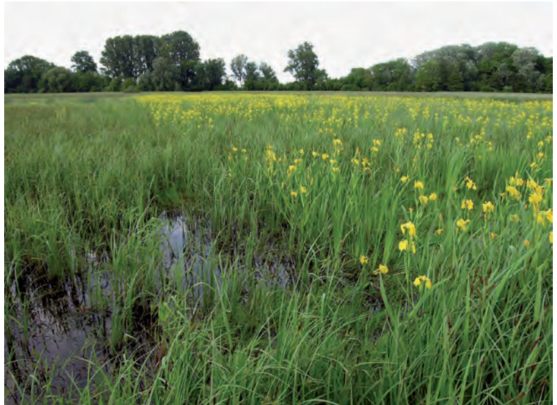
Abb. 13: Besonders wertvolle Feuchtgebiete weisen noch eine intakte Grund- oder Hochwasserdynamik mit anhaltenden Vernässungen auf, wo wie hier an der unteren Leitha die Spezialisten Conocephalus dorsalis , Pteronemobius heydenii , Stethophyma grossum und Chorthippus albomarginatus in hohen Dichten vorkommen können (Zurndorf/B, 134 m, Mai 2010, H.-M. Berg).

Ein sehr spezieller, in seiner flächenmäßigen Ausdehnung zwar unbedeutender, in Bezug auf die Artengarnitur der hier nachgewiesenen Heuschrecken aber besonders wertvoller Lebensraum sind die vegetationsarmen, oft durch dynamische Wasserstandsschwankungen geprägten Uferzonen von Fließ- und Stillgewässern. 80 Arten konnten bisher in derartigen Standorten gefunden werden, doch ist der Anteil an „Irrgästen“ mit 21 % recht hoch. Acht Arten haben zumindest die Hälfte aller ihrer Fundorte an Ufern, darunter hochgradig gefährdete Spezialisten und eine ausgestorbene Art, die Fluss-Strandschrecke Epacromius tergestinus . Auffallend ist der hohe Anteil an „Zwergen“ in diesem Lebensraum, den Grabschrecken Xya und Dornschröcken Tetrix , begleitet aber von auffälligen großen Kurzfühlerschrecken wie