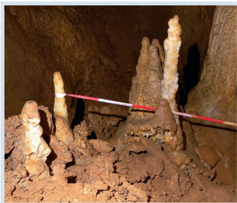
Abb. 4: Unterschiedliche Sintergenerationen beim Abstieg zur Kamillushalle. Erklärungen siehe Text.

solche, die in den letzten 11.700 Jahren, also im Holozän gewachsen sind, oft anhand ihrer hellen und oft weißen Farbe (Abb. 3) von Tropfsteinen unterscheiden, die aus älteren Epochen stammen und eine braune bis dunkelrote Patina tragen. Allerdings gibt es auch Tropfsteine, die einen alten Kern aufweisen und äußerlich „jung“ aussehen.