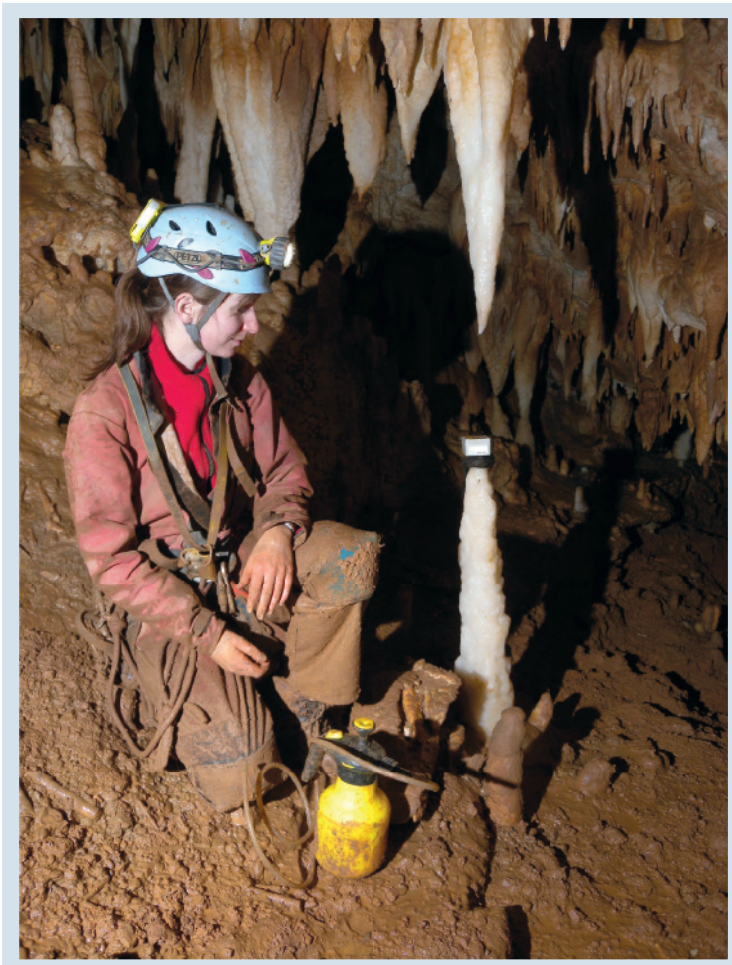
Abb. 3: In der Kamillushalle steht diese schöne Stalagmitenkerze. Die reinweiße Farbe und die Tatsache, dass es vom darüber befindlichen Stalaktiten tropft, belegen, dass dieser Tropfstein noch wächst. Er stellt die nahezeitliche Stalagmiten-Generation dieser Höhle dar. Auf diesem Tropfstein wurde für eine begrenzte Zeit ein Messgerät platziert, das die zeitliche Änderung der Tropfwasserzufuhr aufzeichnete.

halten die Höhlenperlen in der gleichnamigen Perlenhalle am Grund des Allerseelenschachts den Rekord in Österreich (Kuffner et al., 2016).