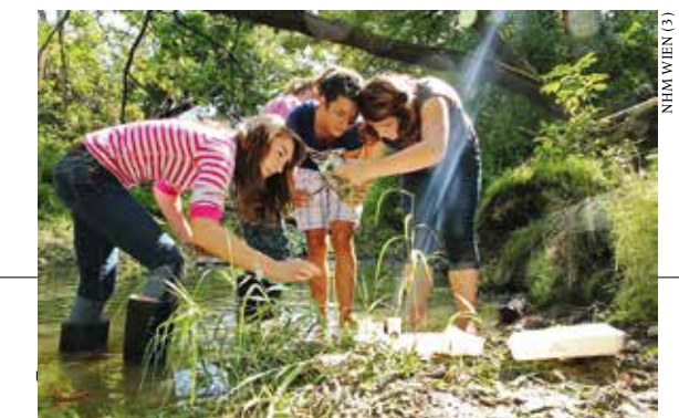
NHM WIEN (3)

Für Schulklassen werden mehrtägige Programme angeboten, die einen tieferen Einblick in die Natur gewähren, wobei sich wesentliche Vermittlungsziele und Themen des Nationalparks wie ein roter Faden durch alle Angebote ziehen. Durch aktives, selbstständiges und spielerisches Tun, Forschen und Entdecken wird Wissen auf solider wissenschaftlicher Basis vermittelt. Im Brennpunkt steht das individuelle Erleben von Natur mit allen Sinnen, wodurch ein tieferes Verständnis für natürliche Gesetzmäßigkeiten und Zusammenhänge sowie für den Wert und die Bedeutung von Pflanzen und Tieren entstehen kann.