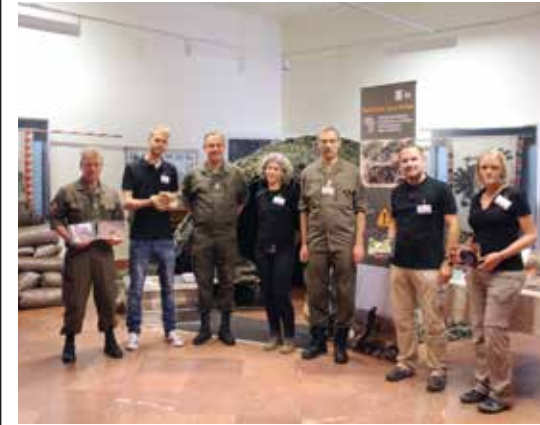
Projektmitarbeiter, die den Forschungsstand organisiert und betreut haben

Schlangenarten angeführt, die starke Gefahrenpotenziale bergen, wie z. B. Vipern (Viperidae) und Giftnattern (Elapidae), als auch Trugnattern, die zum Großteil für den Menschen ungefährlich sind, aber bei einem Biss ebenfalls Gift injizieren können.