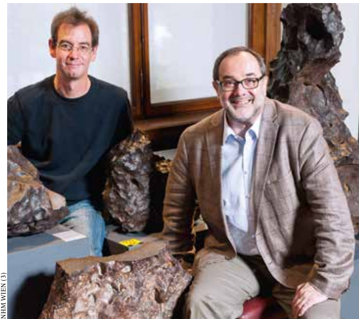
NHM WIEN (3)

H underttausende Asteroiden schwirren durchs Sonnensystem – und manche kommen unserem Planeten ziemlich nahe: 17.000 Gesteinsbrocken sind bekannt, deren Bahnen an die Erde heranführen, und ständig werden neue entdeckt. Unsere Erde zeigt Spuren gewaltiger Asteroideneinschläge. Fallweise donnert ein Meteorit auf die Erde, zerstörerischer als eine Atombombe. Die Treffer aus dem Kosmos können globale Katastrophen und Massensterben auslösen, wie zur Zeit der Dinosaurier. Solche Impakte gab es zu allen Zeiten – und gewiss ist: Es wird wieder passieren. Die kosmischen Besucher sind aber auch faszinierende Forschungsobjekte, die vom Beginn des Sonnensystems berichten.