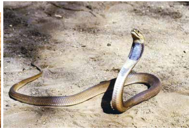
Rote Speikobra – Naja pallida

Das NHM Wien ist als eine der größten außeruniversitären Forschungseinrichtungen Österreichs mit bedeutenden wissenschaftlichen Sammlungen seit fast 130 Jahren eine wichtige Anlaufstelle für Forscher. Im Jahr 2016 wurde der Grundstein für eine besondere Zusammenarbeit gelegt – als das Museum vom Institut für Militärisches Geowesen des Österreichischen Bundesheeres um eine Projektkooperation gebeten wurde. Dieses Institut ist Ansprechstelle des Bundesministeriums für Landesverteidigung, aber auch des staatlichen Krisenmanagements in allen Bereichen des analogen oder digitalen geografischen Daten- und Informationsbedarfes. Das Institut stellt österreichischen Soldaten bei Friedensmissionen in internationalen Einsatzgebieten Informationen über Land und Leute und auch über mögliche Gefahren durch Fauna und Flora zur Verfügung.