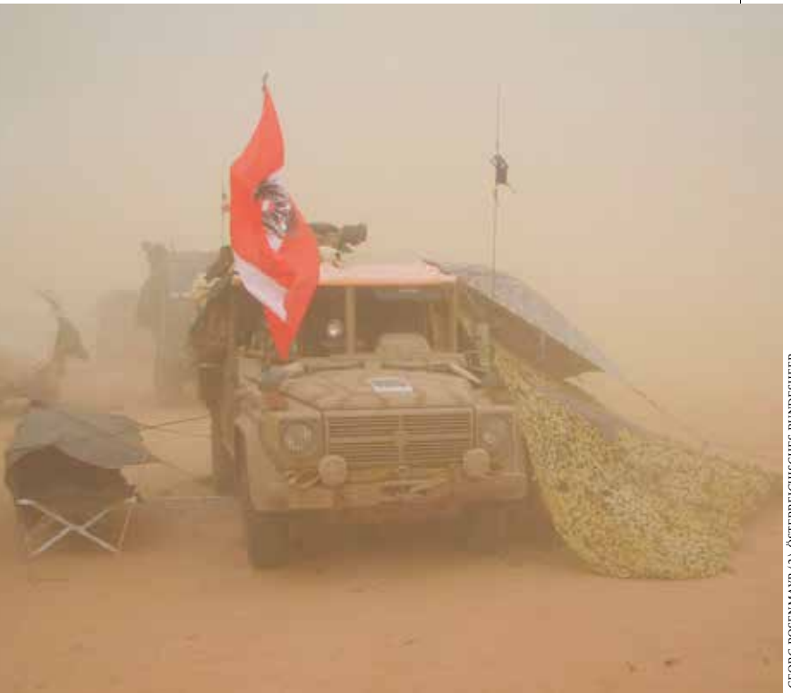
Eine Patrouille des Österreichischen Bundesheeres während eines Sandsturmes

Das Projektteam wurde eingeladen, die Datenbank auch bundesheerintern sichtbar zu machen. Am 7. September