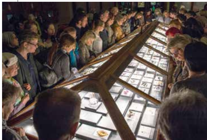
In der neu gestalteten Edelsteinvitrine im Schausaal 4 sind die wertvollen Objekte im wahrsten Sinn des Wortes im neuen Licht zu sehen.

Katzenvideos sowie mit Vorführungen der Zollspürhunde haben reges Besucherinteresse hervorgerufen. Auch die ganz besondere Ergänzung dieser Schau aus dem eisigen Boden Sibiriens, nämlich die in Zusammenarbeit mit dem Zoologischen Institut der Russischen Akademie der Wissenschaften zum ersten