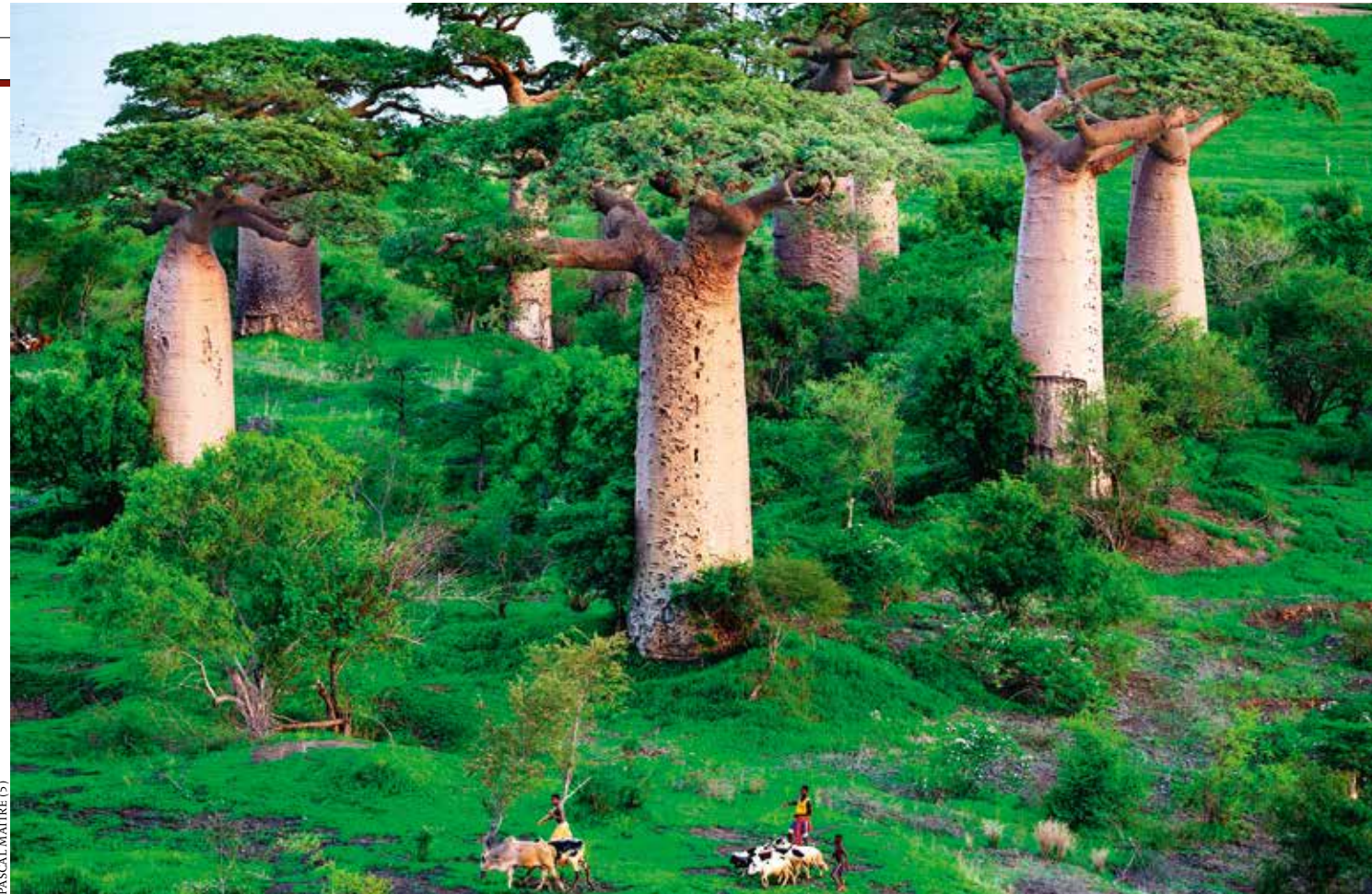
PASCAL MAÎTRE (5)

Zahlreiche mystische Geschichten ranken sich um den Baobab. So z. B. die Erklärung der typischen Wuchsform: Zanahary, der Madagassische Schöpfergott, war auf den Baobab schlecht zu sprechen, weil dieser ständig an allem herumnörgelte. Als es ihm schließlich zu bunt wurde, riss er den Baum aus dem Boden und steckte ihn kopfüber in die Erde – das weitläufige Wurzelwerk gen Himmel gereckt.