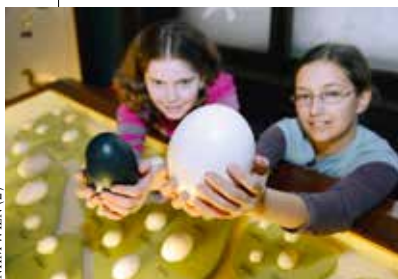
NHM WIEN (2)