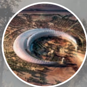
King Abdullah International Garden Saudi Arabien