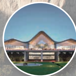
Clark International Airport Philippinen