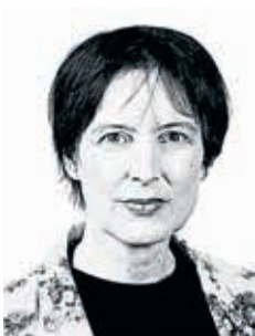
Katrin Vohland (Generaldirektorin)

Die aktuelle Sonderausstellung im Narrenturm behandelt das ambivalente Thema Strahlung und zeigt anhand von Objekten der pathologisch-anatomischen Sammlung die opferreiche Entdeckungsgeschichte. Die medizinische Nutzung und wie sich radioaktive Strahlung, die beim Einsatz von Atombomben oder Reaktorunfällen entsteht, auf menschliche Körper auswirkt sind weitere Themen der Ausstellung.