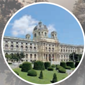
Naturhistorisches Museum Österreich

HERZ Armaturen und das Naturhistorische Museum pflegen bereits seit Jahren eine enge Partnerschaft. Umso mehr freut es uns, dass wir dazu beitragen dürfen, dieses geschichtsträchtige Gebäude auf den neuesten technischen Stand zu bringen und dabei Energie und Kosten einzusparen. Mit 127 Jahren Erfahrung in der HKLS-Branche, schlägt das österreichische HERZ mit 40 Produktionsstätten in 12 europäischen Ländern und 50 Tochterunternehmen auf der gesamten Welt für mehr Nachhaltigkeit. Als bedeutender Hersteller von gebäudetechnischer Ausrüstung, Biomassekesseln und Wärmepumpen sowie Dämmstoffen, sind HERZ Produkte in der Gebäudetechnik für eine erfolgreiche Umsetzung der Energiewende unverzichtbar.