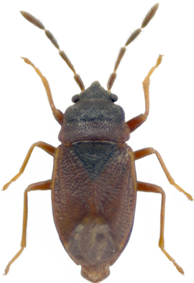
Abb. 6: Drymus pumilio (Lygaeidae); Saarbrücken, 26.09.1997; nat. Größe: 2,4-3,0 mm