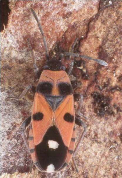
Abb. 4: Horvathiolus superbus (Lygaeidae); Neunkirchen/Saar, 06.10.1996; nat. Größe: 4,0-5,3 mm