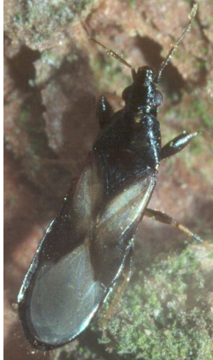
Abb. 3: Scoloposcelis pulchella (Antho- coridae); Homburg/Saar, 07.1986; nat. Größe: 2,8-3,5 mm