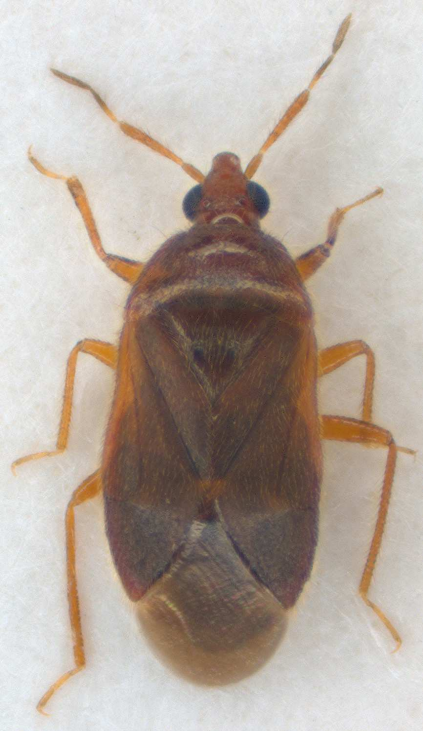
Abb. 2: Cardiastethus fasciiventris (Antho- coridae); Saarbrücken, 08.09.2006; nat. Größe: 2,3-2,7 mm