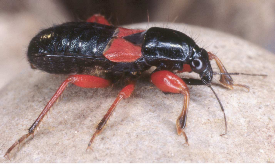
Abb. 1: Prostemma guttula (Nabidae); Wittersheim, 19.06.2004; nat. Größe: 7,5-10,0 mm