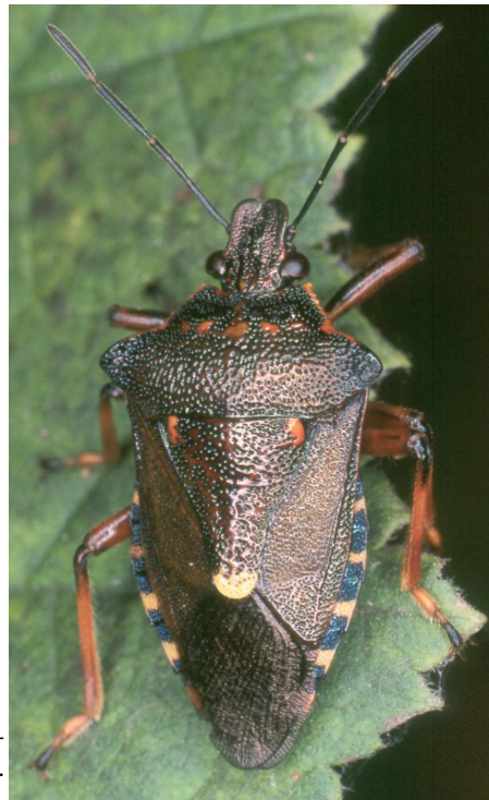
Abb. 7: Pinthaeus sanguinipes (Pentatomidae); Saarbrücken, 21.11.2000; nat. Größe: 11,0-13,0 mm