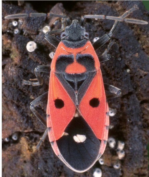
Abb. 5: Melanocoryphus albomaculatus (Lygaeidae); I-Verona, 23.05.1996; nat. Größe: 6,8-9,5 mm