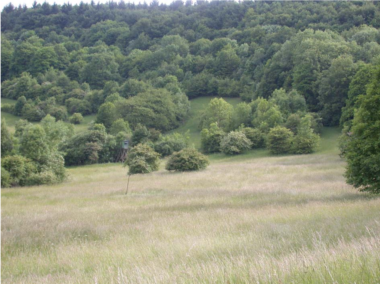
Abb. 4: Habitat von Erebia medusa am Wolferskopf/Peppinger Loch. Im Bild sind frischere, relativ langgrasige Wiesen mit eingestreuten Nassstellen zu sehen. E. medusa fliegt hier regelmäßig, aber individuenschwach. Das Kernhabitat liegt etwa 500 m südöstlich und ist durch eine breite Gebüschreihe getrennt. Der Rundaugen-Mohrenfalter fliegt hier z. B. zusammen mit Carterocephalus palaemon.

Die Luftlinienentfernung der äußersten Nachweispunkte beträgt 2.400 m; unter der Berücksichtigung der Hangmodellierung erstreckt sich das Vorkommen über 3.450 m. Die Entfernung vom Margarethenhof zu den Hängen bei Saarfels und Menningen beträgt 2.300 m Luftlinie bzw. 3.400 m unter Berücksichtigung des Reliefs. Auch wenn die Bereiche um die Jesuitenstücker sich durch eine besonders hohe Habitatdichte bzw. eine besonders gute Habitateignung auszeichnen, kann man davon ausgehen, dass E. medusa seit 2002 die Hälfte des 2002 besiedelten Habitats geräumt hat. Ob es sich um einen Trend oder eine Populationsschwankung handelt, kann erst in den nächsten Jahren beurteilt werden.