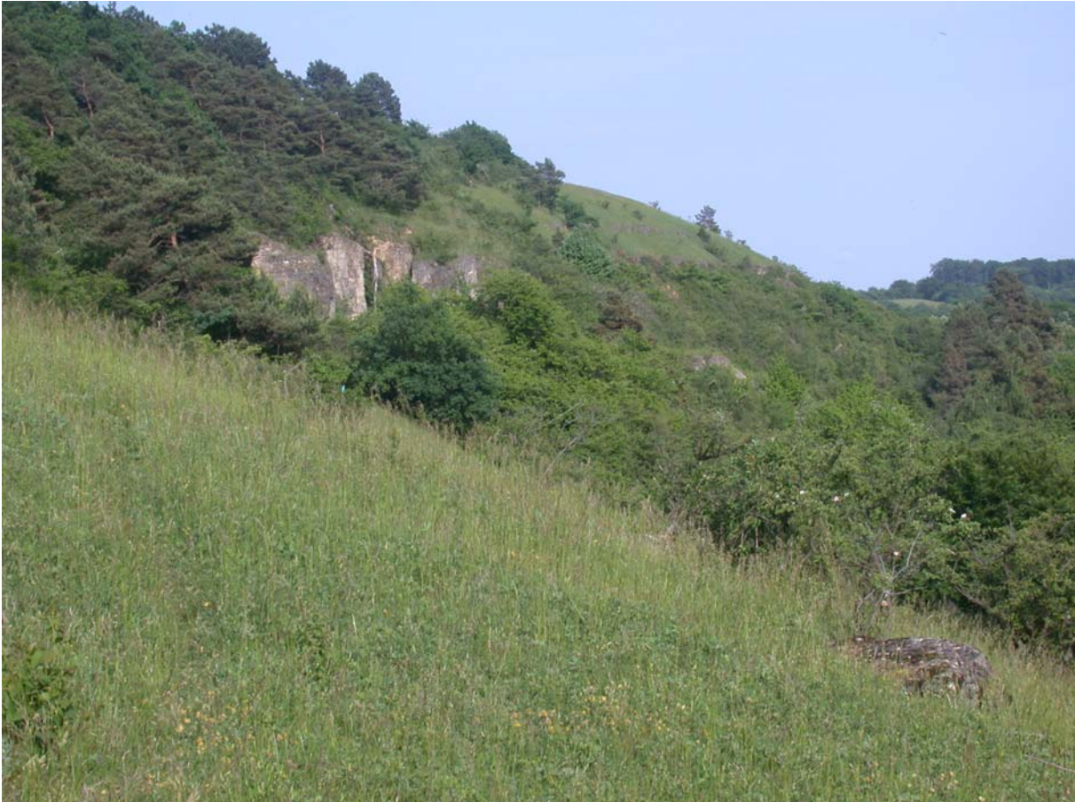
Abb. 3: Habitat von Erebia medusa am Hammelsberg N Apach (F). Unmittelbar am linken Bildrand liegt die deutsche Staatsgrenze. Begleitarten von E. medusa sind u. a. Aricia agestis, Boloria dia, Cupido minimus, Glaucopsyche alexis und Zygaena loti.