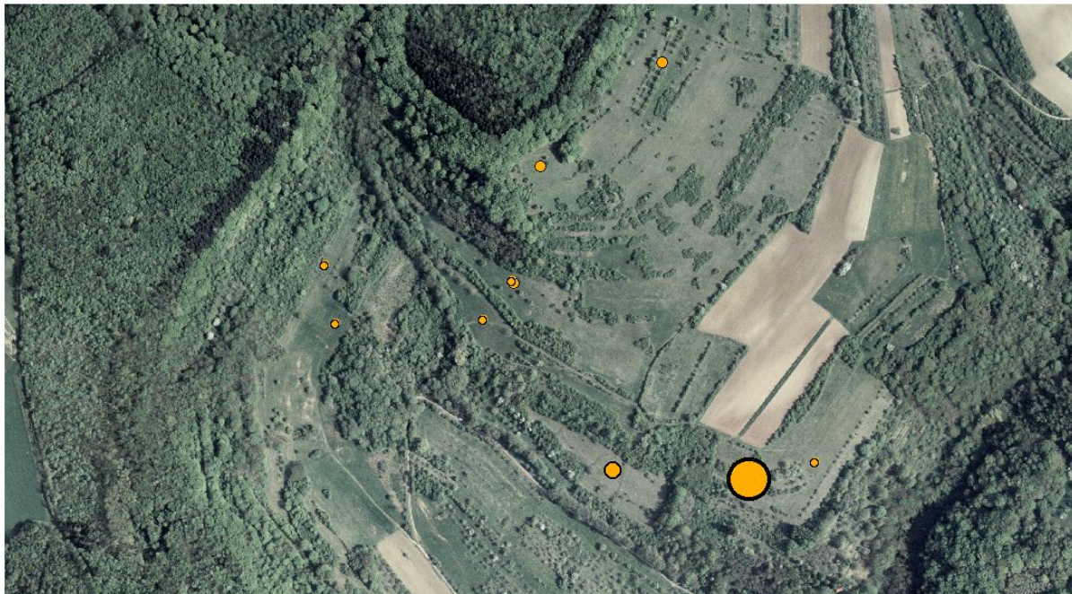
Verbreitung von Erebia medusa am Wolferskopf: Jesuitenstücker - Peppinger Loch

Erebia medusa - Fundorte Wolferskopf 2008