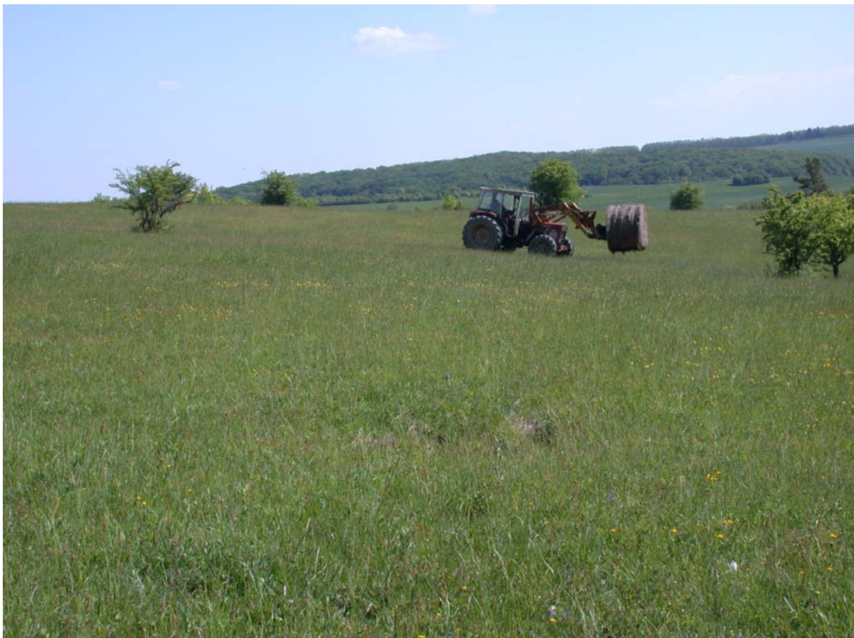
Abb. 2: Ist dieser Halbtrockenrasen das Habitat von Erebia medusa am Buchenberg N Obergailbach (F)? Nicht ganz optimal: Der Landwirt räumt Anfang Mai Heuballen der vorjährigen Pflegemahd ab. Hier fliegt E. medusa sehr vereinzelt zusammen mit u. a. Euphydryas aurinia und Glaucopsyche alexis.