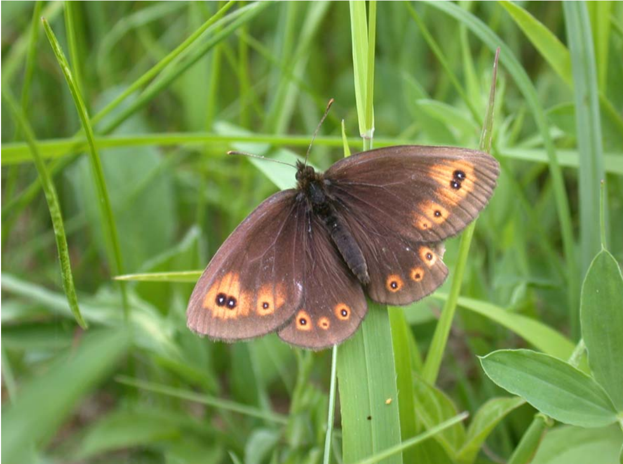
Abb. 5: Porträt des jahreszeitlich ersten beobachteten Falters von Erebia medusa am Wolferskopf (Margarethenhof).

Die aktuell noch festgestellte Population weist zudem eine sehr ungünstige Struktur auf. In zwölf der Patches mit aktuellen Nachweisen konnten maximal drei Imagines beobachtet werden. In einem weiteren Fall waren es sechs Tiere. Die mit Abstand wichtigste Teilfläche ist eine SSW-exponierte, verbrachte und an ihrem unteren Ende stark verbuschte Halbtrockenrasen-Parzelle im Unteren Muschelkalk südlich der Jesuitenstücker (6506/333), auf der am 25.5.2008 56 Imagines von E. medusa markiert werden konnten. Auf der westlich gelegenen Nachbarparzelle, die am 2.6.2008 aufgesucht wurde, gelangen Wiederfänge von drei Tieren der Kernpopulation vom 25.5. sowie eine Eiablage-Beobachtung an Aufrechter Tresse ( Bromus erectus ). Auch bei dieser Beobachtung kann es sein, dass die Population in einer Regressionsphase einer natürlichen Gradation erwischt wurde. Die Tatsache, dass eine gesamte Metapopulation offenbar nur noch an einer Bewirtschaftungsparzelle hängt, muss allerdings als sehr ungünstig bezeichnet werden.