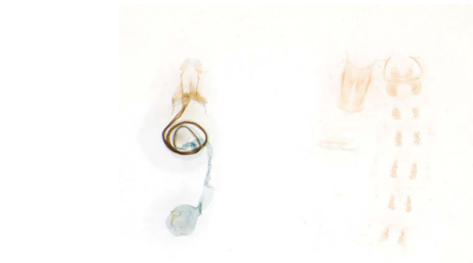
Abb. 3: weibliches Genitalpräparat GU 2315 von Coleophora cracella (Daten siehe Etikett Abb. 2 Mitte)