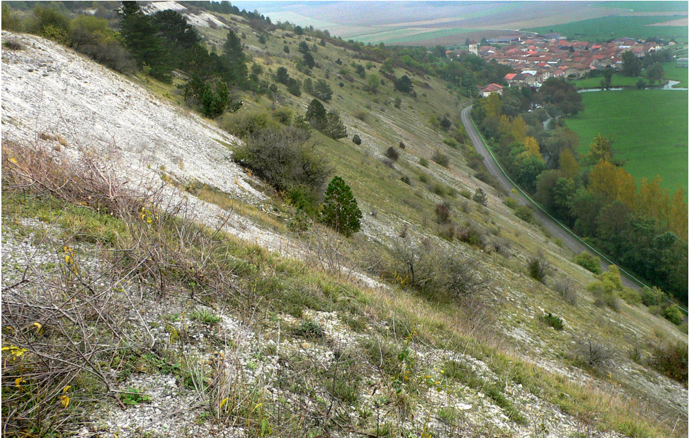
Abb. 3: La Blanche Côte, ein südexponierter Prallhang der Maas bei Pagny-la-Blanche-Côte (Standort Ms4).