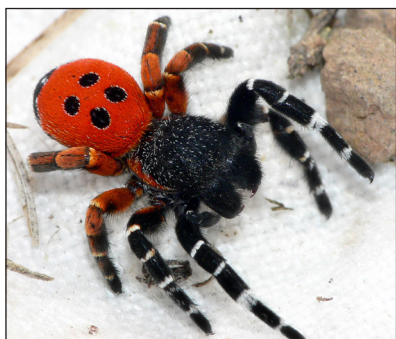
Abb. 4: Die auffällig gefärbten Männchen der Röhrenspinne Eresus kollari laufen im September auf der Suche nach Weibchen (nur etwa 2-3 Wochen lang und vor allem nachts) an der Erdoberfläche herum. Das abgebildete Tier stammt aus dem Nahe-Bergland bei Martinstein (31.08.2008).

Auf Grund ihrer speziellen Lebensweise und hohen Ansprüche an ihren Lebensraum ist bei Eresus nicht mit Neuansiedlungen weit abseits der bestehenden Kolonien zu rechnen.