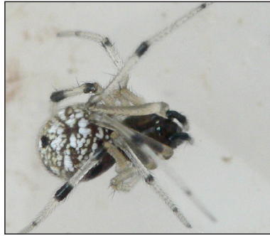
Abb. 14: Männchen und Weibchen der Kugelspinne Neottiura suave- olens , Jézainville, 15.06.2006.