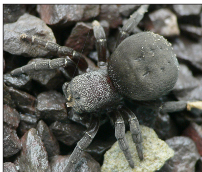
Abb. 5: Weibchen der unterirdisch lebenden Röhrenspinne Eresus kollari , Fontenoy-sur-Moselle, 17.06.2006 (ausgegraben und auf künstl. Substrat fotografiert).