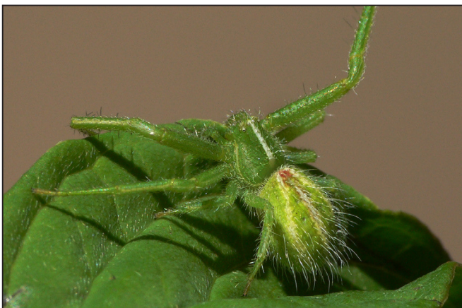
Abb. 15: Krabbenspinne Heiraeus oblongus (= H. mello-teei ), Metz, Mont St. Quentin, 28.04.2007.