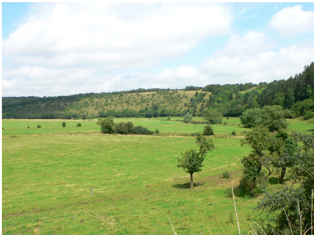
Abb. 2: Südwestexponierter Prallhang «Coteau de la Rivière» des Vair bei Autigny-la-Tour (Standort Ms2).

Koordinaten (WGS84): 48.40687382 5.7604569 Datum: 19.07.2007 und 21.06.2008 Schutzstatus: ZNIEFF 410000452 - COTEAUX DE LA RIVIERE A AUTIGNY-LA-TOUR wertgebende Arten (Auswahl aus der ZNIEFF-Liste): Calliptamus italicus (2001), Mantis religiosa (2004), Euchorthippus declivus (2001), Vipera aspis (2007), Libelloides longicornis (2002) Schutzgebiet des Conservatoire des Sites Lorrains (CSL), Le Coteau de la Rivière (FR1501277)