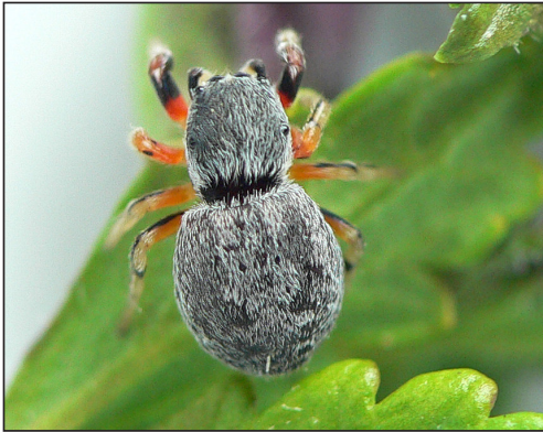
Abb. 13: Weibchen der Springspinne Ballus rufipes , Saulny (bei Metz), 26.07.2008, Jungtiere sind komplett orangerot gefärbt.