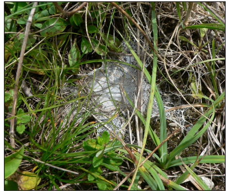
Abb. 6: Oberirdischer Teil des Netzes der Röhrenspinne Eresus kollari , Ailly-sur-Meuse, 07.07.2007. Eine effektive Kartierung der Art sollte sinnvollerweise über die Suche nach diesen Netzen erfolgen und ist so auch ganzjährig möglich.