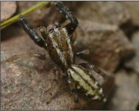
Abb. 12: Junges Männchen der Springspinne Marpissa nivoyi , Fontenoy-sur-Moselle, 17.06.2006.