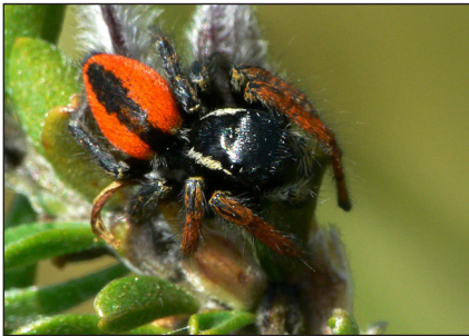
Abb. 9: Männchen der Springspinne Philaeus chrysops , Pagny-la-Blanche-Côte, 06.05.2007.