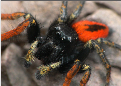
Abb. 8: Männchen der Springspinne Philaeus chrysops , Fontenoy-sur-Moselle, 22.04.2007.

der 17 ausgewählten Arten konnte auf der Fläche gefunden werden. Dies bestätigt die Vermutung, dass thermophile Arten in Höhe Toul den Weg aus dem Maastal ins Moseltal nehmen.