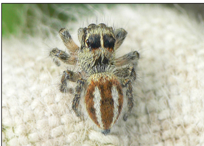
Abb. 11: Älteres Jungtier der Springspinne Philaeus chrysops , Autigny-la-Tour, 19.07.2007. Man beachte die zwei viereckigen schwarzen Flecken auf dem Vorderkörper. Hieran sind auch die Juvenilstadien der Art eindeutig zu erkennen, was für die Kartierung der Art außerordentlich hilfreich war.