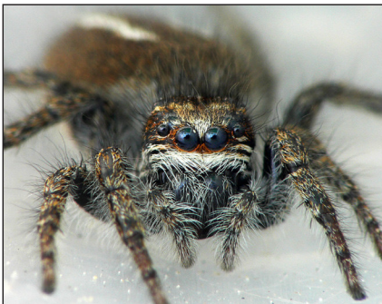
Abb. 10: Weibchen der Springspinne Philaeus chrysops , Fontenoy-sur-Moselle, 22.04.2007.