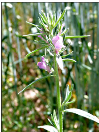
Abb. 4: Misopates orontium (Acker-Löwenmaul)

Herniaria glabra (Kahles Bruchkraut), Petrorhagia prolifera (Sprossende Felsennelke), Portulaca oleraceum (Wilder Portulak), Vulpia myuros (Mäuseschwanz-Federschwingel), Eragrostis minor (Kleines Liebesgras)