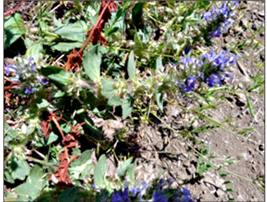
Abb. 3: Ajuga genevensis (Genfer Günsel)

Die wenigen Meldungen vom Genfer Günsel aus dem Saarland kommen überwiegend aus den Kalkgebieten von Blies-, Saar- und Moselgau; weit seltener wurde die Sippe bisher im Nordostsaarland in Bereichen mit basenreichen Vulkaniten nachgewiesen. In über 100 Jahren regionaler Pflanzenforschung gelangen kaum mehr als 20 Funde, zumeist von kleinen Beständen oder Einzelpflanzen. Standorte waren sowohl Trocken- und Halbtrockenrasen als auch Säume trockenwarmer Standorte; die Art ist Kennart der Klasse Festuco-Brometea . Im Untersuchungsgebiet wurde der Genfer Günsel auf einem lichten und felsigen Waldweg innerhalb einer Waldlichtung gefunden.